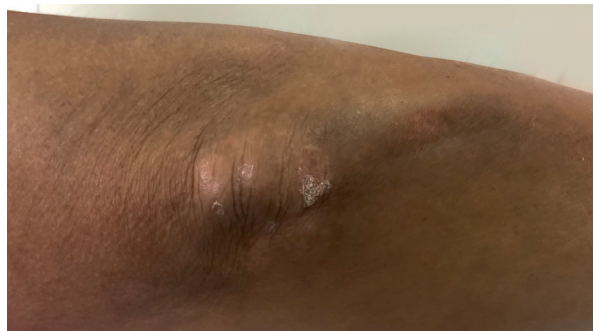
Figura 2 . Lesiones de psoriasis en codo

ta por primera vez en marzo de 2016; con antecedente de diagnóstico de psoriasis cutánea a los 30 años, sin antecedentes familiares y de haber sido tratada con anterioridad. Además refiere ser tabaquista y peluquera. La paciente acude por dolores articulares y edema de rostro, manos y pies de 7 meses de evolución, acompañado de rigidez articular matutina.