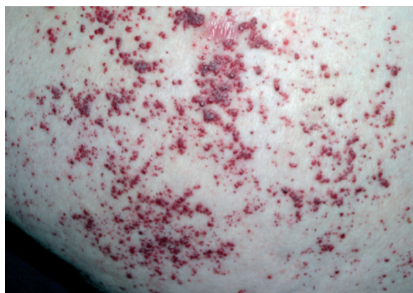
Figura 2 Angioqueratomas 12

Son angiomas vasculares de coloración violácea, que no desaparecen con la digitopresión, distribuidos en forma de clusters, más densas en la región peri-