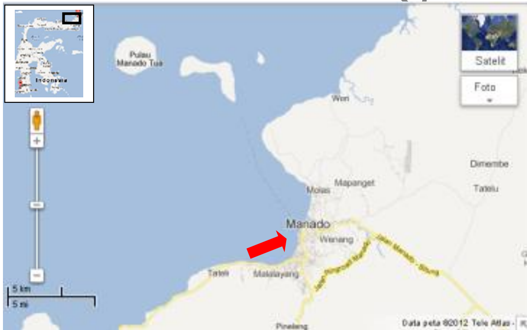
Gambar 1. Lokasi Penelitian di Intertidal Pantai Malayang

Nontji, A. 2007. Laut Nusantara. Djambatan. Jakarta. 372 hal.