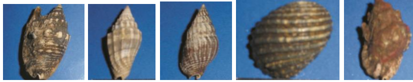
Mitra imperialis, Nassarius crematus, Strombus bulla, Priene scarbum, Coralliophila parva