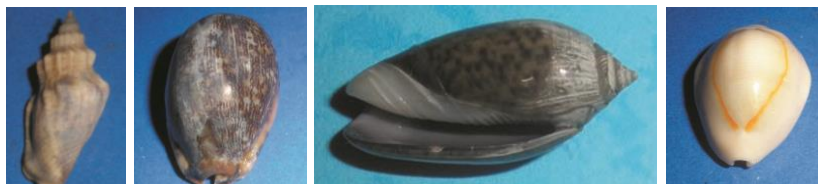
Batillaria sp, Cypraea arabica, Oliva oliva, Cypraea annulus