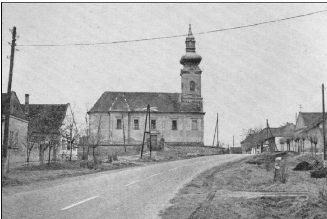
A szerb (görögkeleti) templom