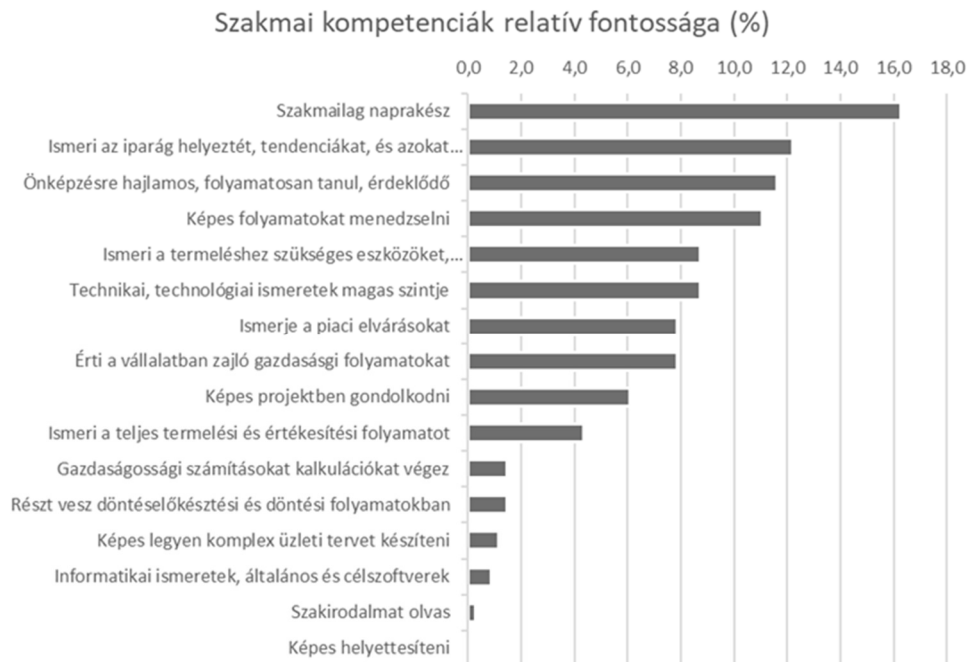
2. ábra: Szakmai kompetenciák fontossági sorrendben

Részletesebben a 2. ábra tartalmazza a szakmai kompetenciák fontossági sorrendjét az említett kérdésekre. Jól látszik, hogy igen jelentős eltérés van az említések számában.