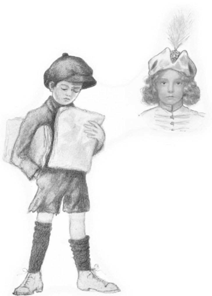
Illusztráció A Kiskirály című könyvből