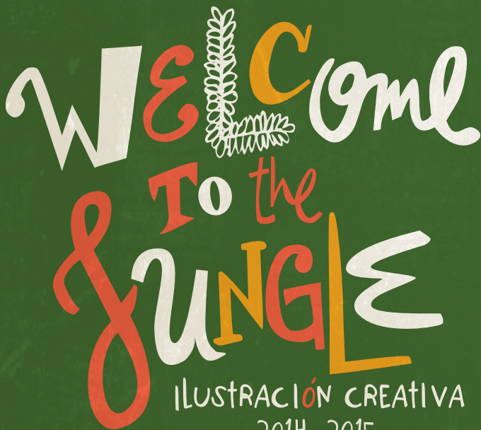
ILUSTRACIÓN CREATIVA 2014 - 2015