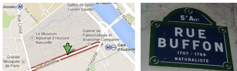
La Rue Buffon.

Havia planos para esta rua desempenhar um papel importante em Novembro de 2013, como parte de uma acção para a divulgação da Matemática. A Comissão RPA (“Raising Public Awareness”) da European Mathematical Society (EMS) reuniu-se nesse mês em Paris, e surgiu a ideia de “reconstituir” a experiência de Buffon, simbolicamente, na própria Rue Buffon. As condições não podiam ser mais propícias: a Matemática correspondente pode ser facilmente compreendida por um público leigo – não sendo, por outro lado, completamente trivial – e, com contactos apropriados e alguma preparação profissional, seria razoável esperar uma boa cobertura mediática, realizando assim uma acção significativa para a divulgação da Matemática.