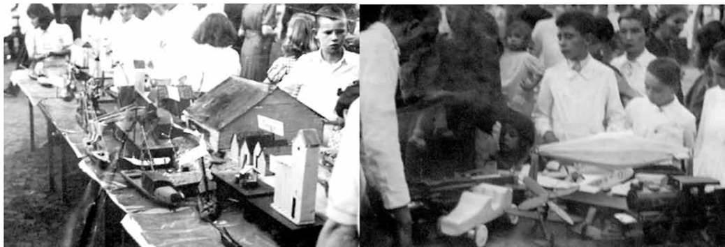
Muestras y exposiciones en las Misiones Culturales.

comunidad. Y los niños enseñaban a hacer jabón, comunicaban lo que habían aprendido acerca de los alimentos y las mejores recomendaciones para afrontar la desnutrición, y estas misiones culminaban con espectáculos artísticos o el coro de niños pájaros o una obra de títeres o una obra de teatro: la escuela y la comunidad unidas por actividades culturales y educativas.