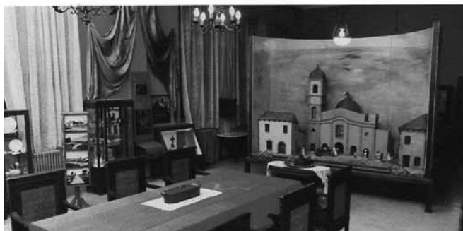
El Museo Geográfico Dr. Juan B. Terán forma parte del Complejo Museológico del Instituto Félix Bernasconi de la Ciudad Autónoma de Buenos Aires.