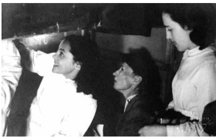
Leticia Cossettini junto a unas niñas. La fotografía es reveladora del entusiasmo y el descubrimiento en la situación educativa.