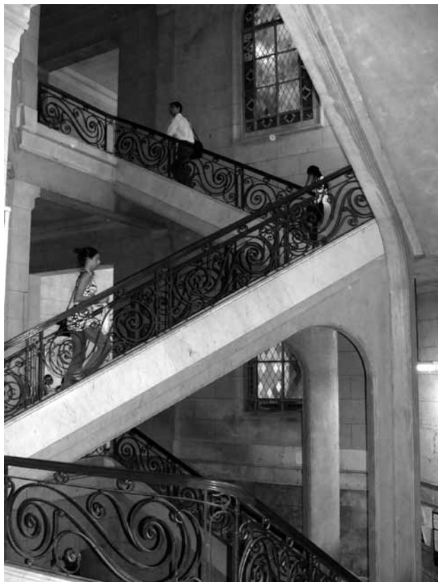
Escuela Normal Superior José María Torres, de Paraná (Entre Ríos), fundada en 1869. En la actualidad depende de la Facultad de Humanidades, Artes y Ciencias Sociales de la Universidad Autónoma de Entre Ríos.

se ponía una escuela. A partir de 1870 ya no. Uno tenía que haber aprobado exámenes, haber leído a Torres, a Freud, a Rousseau. Haber hecho prácticas, haber hecho residencias. Aparece la profesionalización y, a su vez, la docencia comienza a volverse un empleo único. Hasta 1870-1880, quien era docente era docente y a otra cosa. Era docente y sacerdote, por ejemplo, o era docente y herrero. Aparece la idea del docente laico, y me estaba olvidando de esta característica. Además de profesión única –el docente sólo es docente, no es docente y realiza otra actividad–, aparece también la idea de la titulación y de la feminización, que es donde me quiero detener: cómo comienza a pasar,