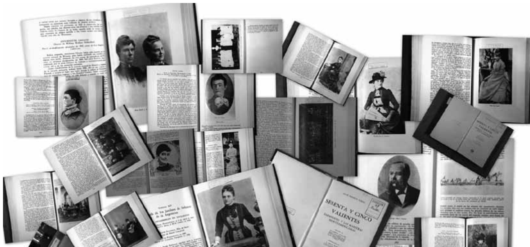
Imágenes extraídas del libro Las 65 valientes , donde se encuentra registrada la llegada de las maestras que llevaron a cabo la propuesta de Sarmiento para el Jardín de infantes.