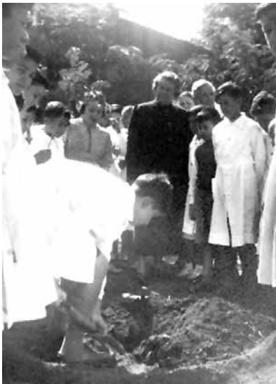
Visita de Gabriela Mistral a la Escuela.

El mundo de la educación y la cultura, de aquí y del resto del país, admiraban a Olga y a Leticia. Llevaban a sus alumnos al teatro, invitaban a la escuela a las personas ilustres, proyectaban con legítimo orgullo sus ideas avanzadas. Una vez recordó Leticia en el acto del Parque España que recibió en su escuela a la célebre Margarita Xirgu, quien escuchó emocionada cómo los niños recitaban sencillas poesías y poemas castellanos. Los invitó al teatro donde actuaba y pidió que se ubicaran muy cerca de ella, junto al escenario. También narró Platero y yo , consiguió que los alumnos volcaran en el papel su interpretación de la obra sin par de Juan Ramón Jiménez, y luego, en un sobre inmenso envió al poeta andaluz y universal los dibujos y acuarelas que representaban al melancólico burrito. Tres años más tarde, cuando dispuso venir a la Argentina, le manifestó su deseo de viajar a Rosario para conocer la escuela. Todos trabajaron para transformar el teatro. Y Juan Ramón Jiménez lloró desbordado por la emoción de aquel día memorable para el colegio y para la ciudad.