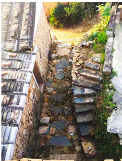
图8 铺设平整的石板路

间卧室改为三人间,厨房2改为书吧,并在西侧增加了厨房的功能。内部改装的同时进行了屋面修整、墙体粉刷、地砖重砌等工作。