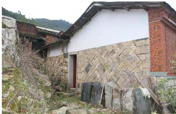
图4 田边厝改造前实景