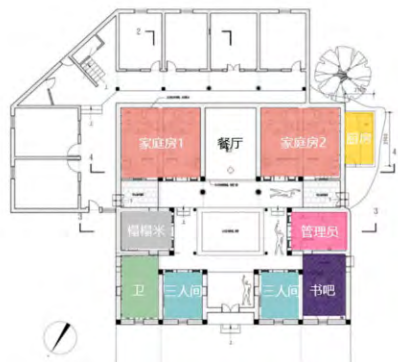
图6 改造后功能布局