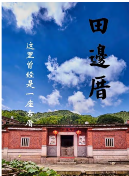
图9 田边厝完工实景

间卧室改为三人间,厨房2改为书吧,并在西侧增加了厨房的功能。内部改装的同时进行了屋面修整、墙体粉刷、地砖重砌等工作。