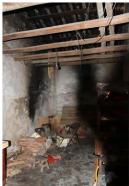
图3 田边厝改造前室内