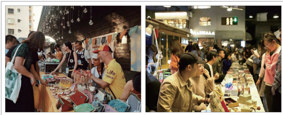
图3 沙坡尾市集