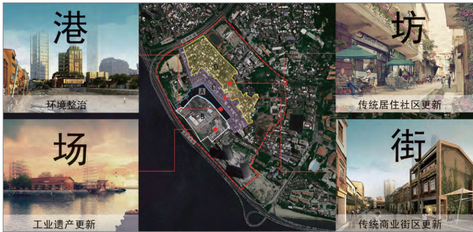
图1 沙坡尾社区的多元功能构成

类型混杂低端，社区居民收入微薄；房屋产权错综复杂，社区更新严重迟滞；环境设施亟待改善，社区人文环境亟待保护。