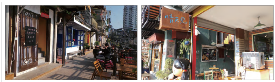
图4 沙坡尾社区创意小店 资料来源: http://you.ctrip.com/travels/gulangyu120058/2257236.html 。