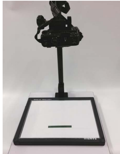
图2 拍摄装置效果图

图像测量技术 固定拍摄装置(图2), 打开发光板(底部打光), 将鲜活的对虾放入经低温预处理的海水中(16~18 °C), 待对虾安静后, 取一尾用滤纸去除多余水分, 正立置于背景纸上完