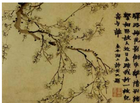
图2 清 金农 《墨梅图》