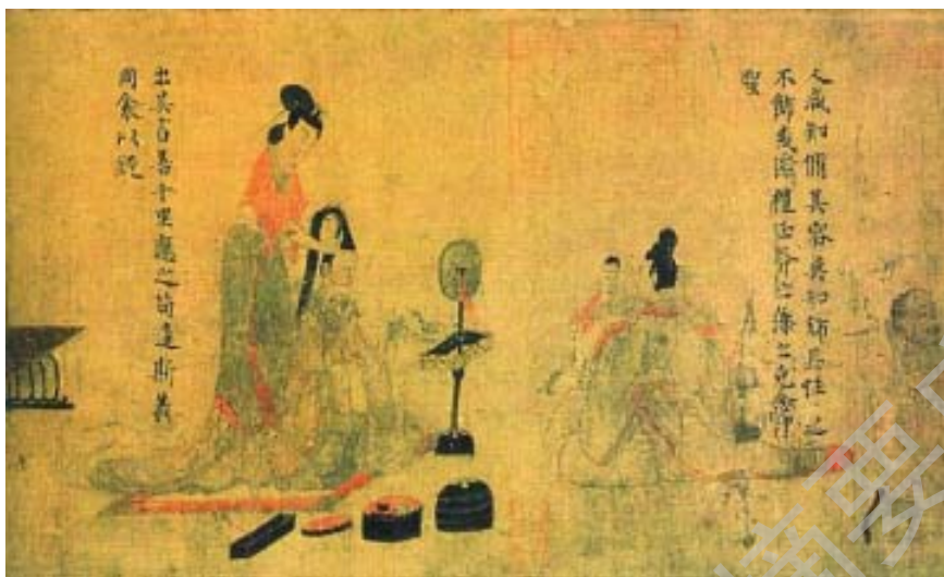
图1 东晋 顾恺之《女史箴图》（局部）