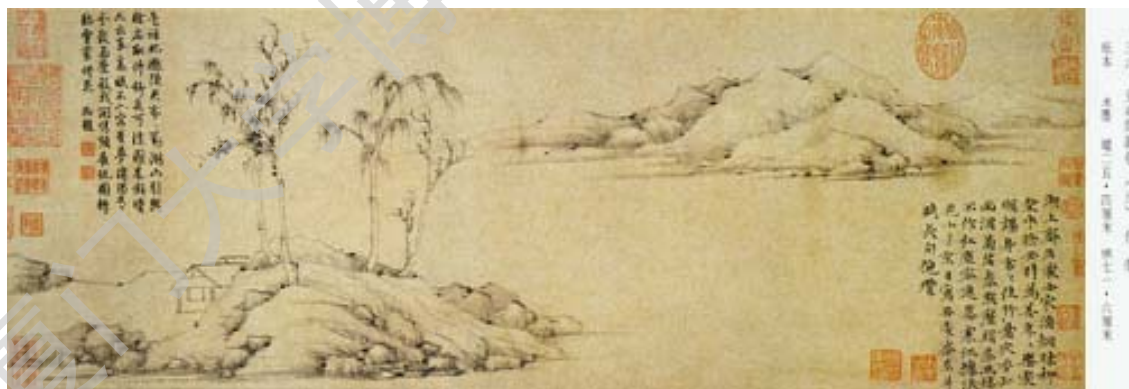
图4 元 倪瓒 《安处斋图》

虽然历代不同画家们他们生活的地理环境、文化背景、画家个性气质等因素有所不同，但他们的绘画作品都能给人一种超然脱俗、宁静、平淡、幽远之感，达到一种“逸”的境界，“逸”其实是一种朴质纯真的风格，其基本条件是自然天真、不假雕饰的，说明画家们对绘画都是有极高追求的，追求天人合一的境界。那么，在作品中怎么表现，如何在画面当中去追求这样的高拔的格调？石涛在“蒙养”一说里给出了答案：“蒙以养正”是“使蒙昧之人通过养而归正”，要“以蒙养心，以蒙正己” ① 。“蒙”是表达生命原初的状态，是纯被圆融的自然之道，隐含着无穷的创化和力量，要用“蒙”来滋养自己的心性和修养德性，修养的成果也就成为了人的精神气息，这种精神气息又反映在作品上成为画品格调。所以，修身养性，蒙以养正是画家追求画品格调更高境界的正途。