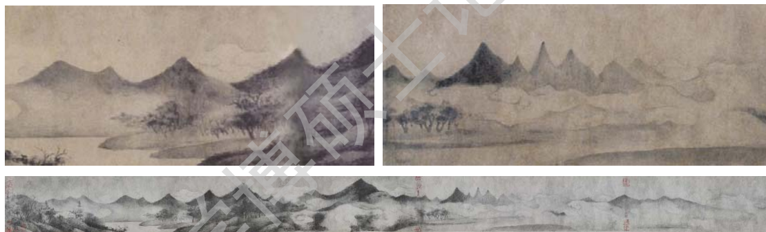
图5 宋 米友仁 《潇湘奇观图》

“鸿蒙”即“天地氤氲流荡的空间” ① ，这种恍惚幽渺的鸿蒙状态就是万事万物浑然一体，天地合一，对世界整体的关照，在绘画中要运用“鸿蒙”的观察方法。如图5米友仁的《潇湘奇观图》，描绘出了云雾缭绕的江南山水的景象。山峦起伏、没骨晕染，运用虚实对比营造虚淡之境，更画出了自然的元气。烟云将连绵的山峦串联起来又延伸了山峦的气脉，虽只描绘了一座完整的山却因烟云的环绕延展而使