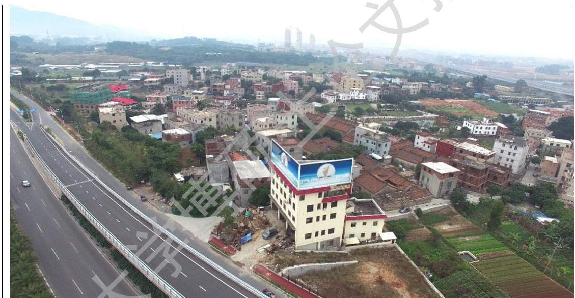
图 1-1 简陋、趋同的方盒子建筑和媚俗的假洋建筑

近二十年来，随着国内城市化的进程，建筑产业可谓突飞猛进、日新月异，呈现出爆发式增长，许多大都市的建筑已经赶上国际先进水平，然而，与此同时，城中村、乡镇、及自然村新建农村建筑（特别是 80 年代以来）却普遍存在：简陋、趋同、媚俗、缺乏创意、缺乏地域特色等，出现许多以占地为目的无视环境的抢建建筑。这些新建筑远看如同一堆堆方盒子垃圾堆，许多具有优秀价值的古民居建筑已经被恣意破坏、拆解、分割而淹没其中，许多农村已经完全失去农村所应有的环境优美与乡村风情（图 1-1）。