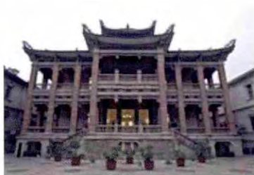
1 | “海天堂构”建筑群

厦门近现代历史建筑保护的第二阶段比第一阶段完善许多,但仍然存在的问题。以鼓浪屿为例,旅游业的发展给鼓浪屿带来了大量商机,也增加了其历史建筑的商业价值,这也造成了大规模的历史建筑改造再利用。2014年3月,厦门市政府提出《美丽厦门战略规划》,提出“美丽厦门,共同缔造”诉求的历史条件,是城市设计工作的挑战,