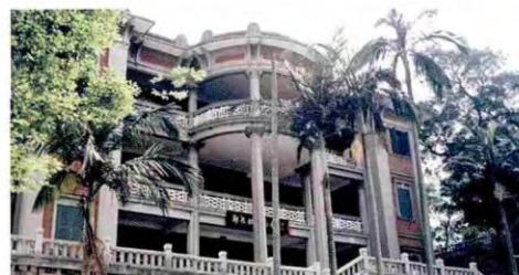
2 | 西林别墅