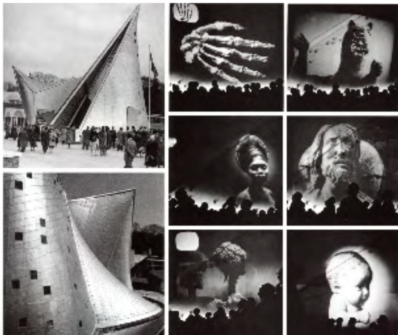
图9 1937年布鲁塞尔世界博览会展馆外观及《电子之诗》片段

非。在旅行中,他努力抓住每一处地方的宏观与微观尺度的影像特征来创造自己的艺术与设计。在巴西的一场空中探险使他有幸鸟瞰大地,柯布西耶称之为“水煮蛋”(poached egg)和“宇宙奇观”(cosmic spectacle);在南美洲飞行之旅中,柯布西耶带着他的“漫游法则”看到了乌拉圭、巴拿马及亚马孙河,他将这些河流的流动、流向与人类的创造力联系在一起,将观察与转译相结合,这些新的漫游体验直接影响了随后他在里约热内卢和阿尔及利亚的都市规划设计。