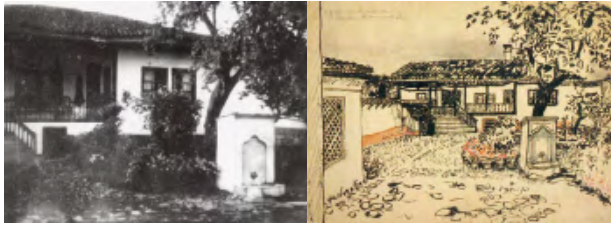
图1 柯布西耶在“东方之旅”中同时用摄影和速写来记录建筑