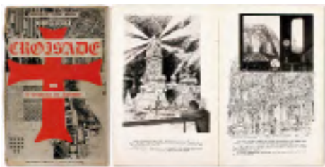
图7 《改革, 学术之光》(1933年)封面及内页混合了绘画、摄影的拼贴