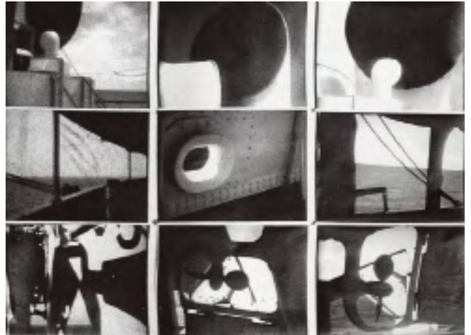
图4 柯布西耶拍摄的蒸汽船系列照片

方式。尽管其中的一些照片具有较高的影像素质,但很难将其界定为专业摄影。同时,摄影并没有给柯布西耶带来长久的兴奋,在“东方之旅”后不久,他第一次放弃了摄影,转而全身心投入绘画(图1,图2)。