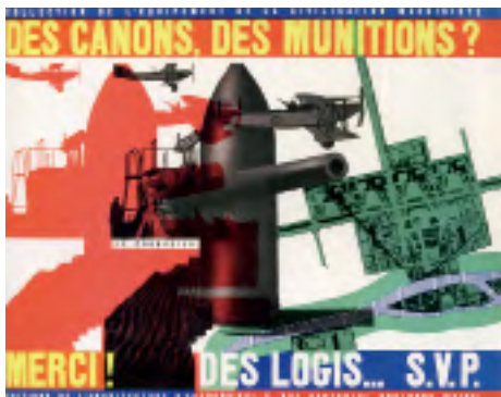
图8 《枪械和军火? 请不要! 给我们栖身之所》封面