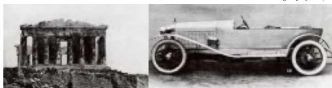
图6 《走向新建筑》一书中并置的帕提农神庙与汽车 (图片来源: 勒·柯布西耶的《走向新建筑》一书)

黑白、具象与抽象，城市、建筑、室内场景的反复纠缠也加剧了影像的片段化特征(图7,图8)。