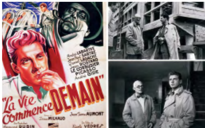
图5 电影《生活从明天开始》海报及电影中柯布西耶的镜头

柯布西耶的照片拼贴大篇幅影像在1937年巴黎世界博览会期间初步扬名。随后，他进一步挖掘照片拼贴与建筑设计、空间表现相结合的视觉潜力。影像在被精心设计、裁剪后合成多种形状，包括楼梯、脚手架、多边形、建筑轮廓、建筑总平面图及建造的各个阶段。1938年出版的著作《枪械和军火？请不要！给我们栖身之所》(Cannons, Ammunition? No, thanks. Housing Please)的封面是这一时期柯布西耶具有代表性的照片拼贴作品，与柯布西耶同时期的绘画构图较为相似，整个画面由红、绿、蓝三原色构成，亮红色构成飞机、大炮和弹药的双重剪影，巴黎的城市地图为透明绿色，河水被描绘成蓝色。这种介于摄影与绘画之间的拼贴可谓波普艺术(Pop Art)盛行之前的一种影像实验，结合了摄影与绘画、彩色与