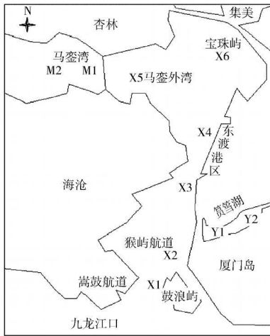
图 1 厦门西海域采样站位分布

大, 近两年刚进行大规模疏浚, 今后还会疏浚; 马銮湾两个 (M1、M2 站) 受杏林工业区排污影响大, 近期将进行大规模疏浚; 厦门西港 6 个 (X1—X6 站) 其中 X1 为高鼓航道; X2 为猴屿航道, 排污口附近, 受到城市污水影响较大, 这两站均为厦门西港的主航道, 疏浚量大; X3、X4 为东渡港区, 有港口污水排入, 每年需要疏浚; X5 为马銮外湾, 杏林工业区及其污水处理厂排污口附近; X6 为宝珠屿北部内湾, 水流平缓。以上站位均为拟疏浚的主要区域。