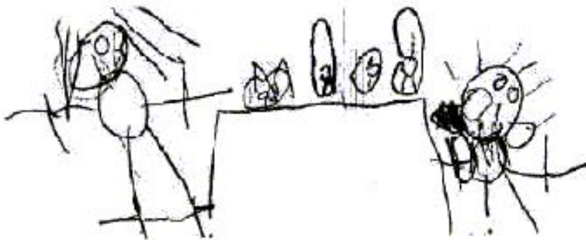
Virginia, la autora del dibujo dijo: “Los chicos miran el experimento donde mezclan la sal y el hielo y meten al lobo en el tubo con agua que se hace hielo”