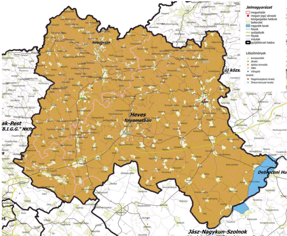
6. ábra Az NHKV által javasolt régió

A szolgáltatásokat tekintve a régió a következőképpen néz ki: