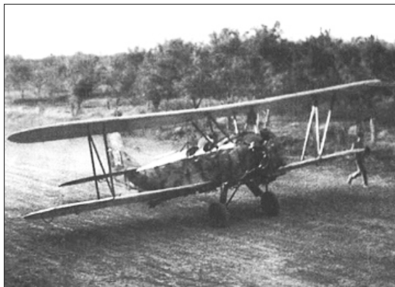
Фото 1. Літак По-2. На таких літали «нічні відьми»

ли студентками університетів та інститутів, факультетів математики, фізики, історії. За три роки полк пройшов бойовий шлях від Терек до Берліна. Бомбили ворогів у передгір'ях Кавказу, на Кубані, на Таманському півострові, в Криму, в Білорусі, Польщі й Німеччині. Бомбили переправи, вогневі точки, скупчення військ, залізничні