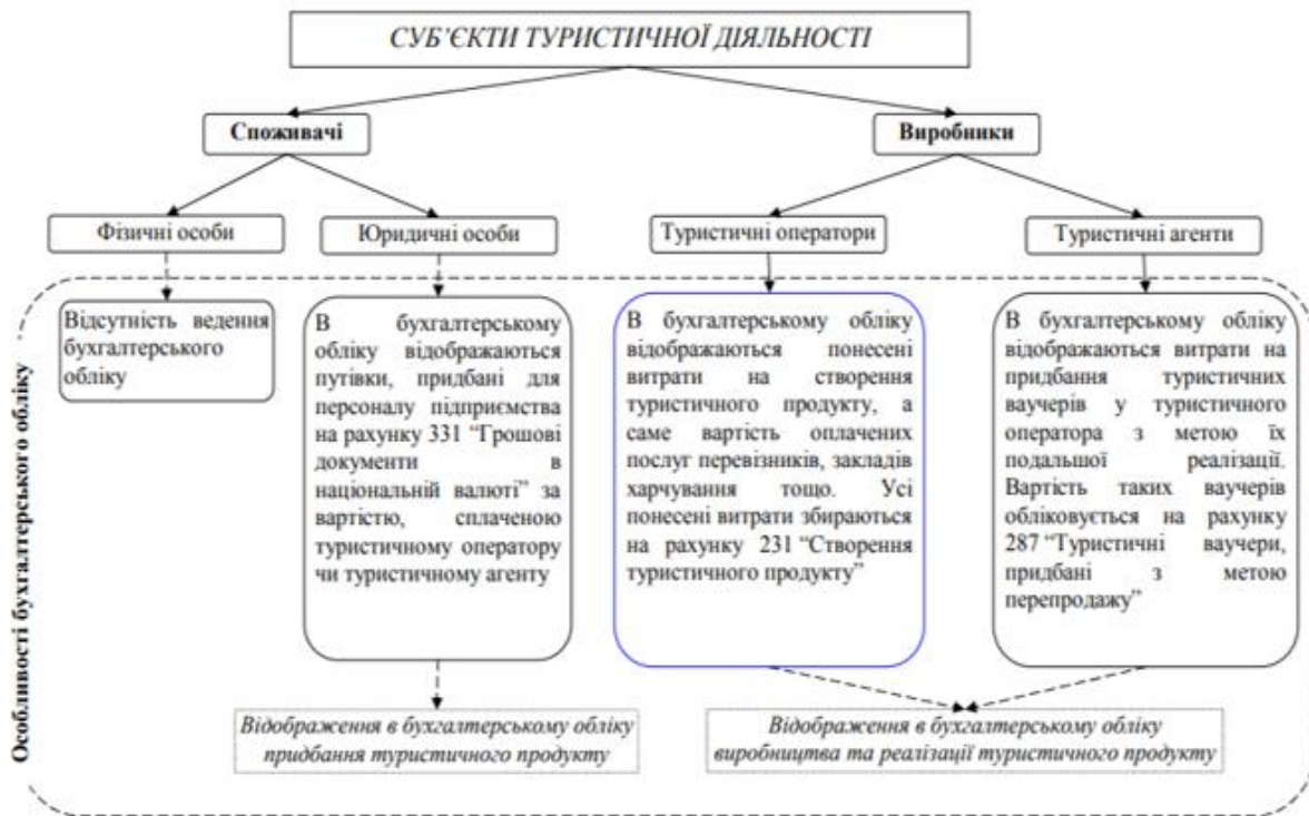
Рис. 1 Суб'єкти туристичної діяльності та особливості бухгалтерського обліку у них

Туристичний оператор може формувати туристичний продукт і самостійно його реалізовувати, а туристичний агент лише придбає готовий туристичний продукт у туристичного оператора з метою його перепродажу. Тому в бухгалтерському обліку у туристичного оператора відображаються операції, пов'язані з формуванням собівартості туристичного продукту. Відповідно до цього слід вести бухгалтерський облік витрат на створення туристичного продукту за статтями калькуляції на рахунку 231 "Створення туристичного продукту". У туристичного агента обліковому відображенню підлягають витрати на придбання туристичних ваучерів (придбаний туристичний продукт призначений для перепродажу) з метою їх подальшої реалізації. Вартість таких ваучерів слід обліковувати на субрахунку 287 "Туристичні ваучери, придбані з метою перепродажу".