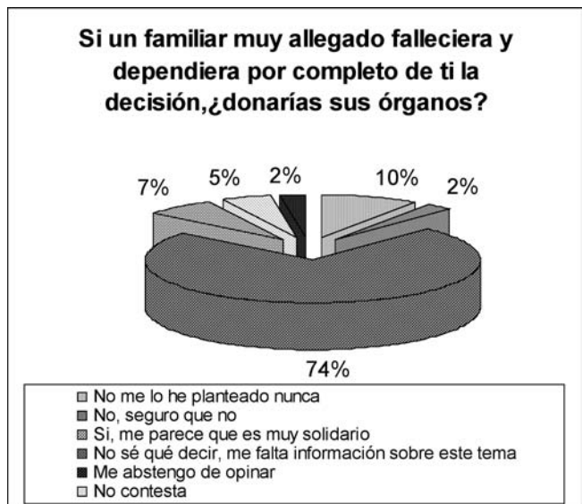
Gráfico 2. Actitud ante la decisión de donar órganos de un familiar.

La puntuación media del vídeo fue de 3,38 (1 a 5). Aquellos que no eran donantes de órganos otorgaban una mayor puntuación al vídeo (p = 0,005). A la pregunta "sí dependiera de ellos la decisión de donar los órganos de un familiar", la respuesta fue mayoritariamente positiva (gráfico 2).