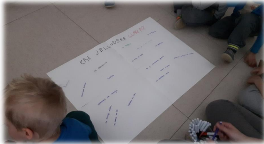
Slika 1: Beleženje odgovorov otrok

Otroke sem vprašala, kaj je ljudska glasba. Odgovore smo skupaj zapisali na plakat. Navajam odgovore otrok, kaj je po njihovem mnenju ljudska glasba: »Slovenska glasba, zelo glasna glasba, glasba na klavir, glasba o pustu, da je iz ene države, iz zvonca na hiši, napisana je na listu, da bi koza na hrbtu nosila glasbo, glasba v čarobnem lončku, zelo mirna in tiha glasba, glasba, ki jo slišimo na zvočnikih/radiu/računalniku/televiziji, v avtu/motorju/tovornjaku, glasba na harmoniki.«