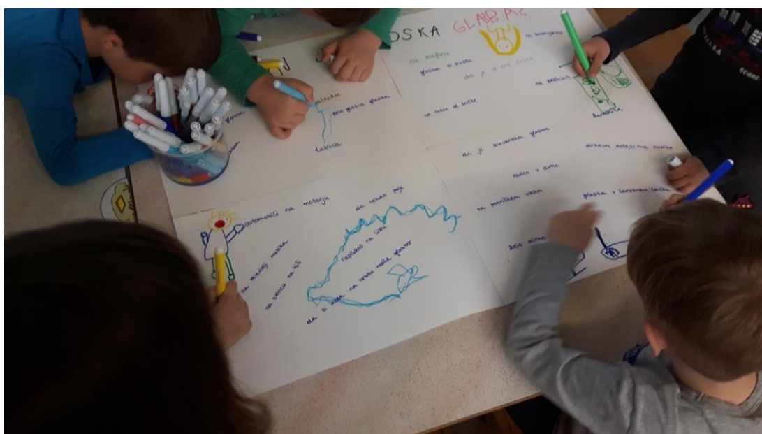
Slika 3: Izdelava plakata o ljudski glasbi