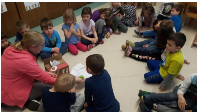
Slika 4: Pregled domače naloge

Dvodnevno dejavnost smo zaključili z ljudsko rajalno igro Bela, bela lilija. Približno polovica otrok jo je že poznala, drugi so jo usvojili po večkratnem ponavljanju. Vsi otroci so izrazili veselje ob učenju nove ljudske rajalne igre, s čimer so potrdili kakovostno zastavljene cilje dejavnosti.