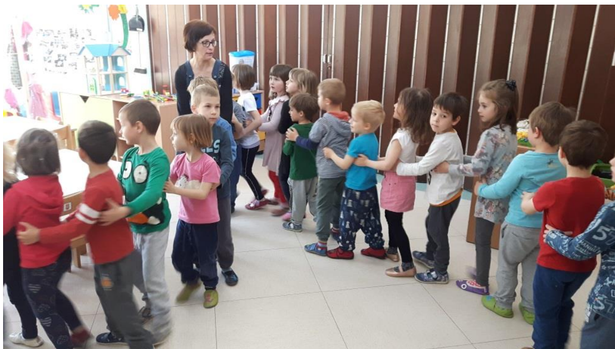
Slika 13: Ljudska plesna igra Abraham 'ma sedem sinov

V naslednjih dveh dneh smo z otroki prepevali naučene ljudske pesmi in jih spremljali na ljudske inštrumente, narejene v vrtcu in prinesene od doma. Prepevali in plesali smo ljudske plesse ter si ogledali še nekaj fotografij, povezanih z ljudsko glasbo. S ponavljanjem sem želela ugotoviti, kako so otroci sprejeli projekt. Vsi otroci so prepevali ljudske pesmi in sodelovali pri ljudskih plesih. Ljudsko glasbo so sprejeli zelo hitro, besedila in melodije so jim šli v uho, imeli pa so tudi voljo do sodelovanja, saj jih je tema zanimala.