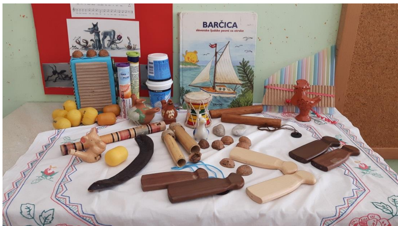
Slika 14: Glasbeni kotiček

Tokratne dejavnosti so vključevale odgovore na vsa zastavljena raziskovalna vprašanja. Otroci so že na začetku imeli pozitiven odnos do ljudske glasbe, skozi naše skupno seznanjanje z njo pa so začetno znanje zelo obogatili. Z izdelavo glasbenega kotička so dokazali, da imajo ogromno idej, kako ljudsko glasbo vključiti v oddelek. Sodelovanje z ljudskimi pevkami in godci jih je spodbudilo k nadaljnjemu raziskovanju, odprle so se nove ideje in želja po širšem poznavanju ljudske glasbe. Igra, ki se je razvila po končanih skupnih dejavnostih, je bila močno navezana na ljudsko glasbo. Otroci so vanjo vključevali ljudske pesmi in plese ter igranje na ljudske inštrumente. Tako sem pridobila vse odgovore na raziskovalna vprašanja, ki so me zelo pozitivno presenetili, saj na začetku nisem pričakovala takšnega odziva.