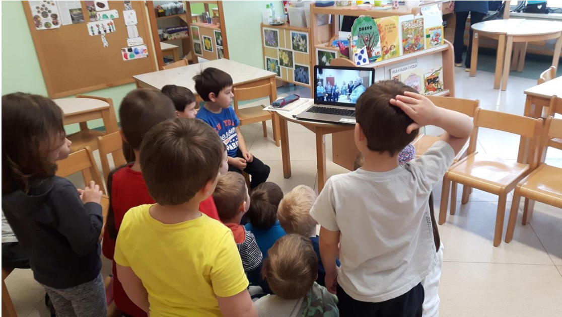
Slika 6: Ogled videoposnetka z odzivom ljudskih pevkv in godcev

Temo sem napeljala na uspavanke. Večina otrok ni poznala nobene uspavanke, saj jim jih starši ne pojejo. Spodbudila sem jih, naj zaprejo oči in prisluhnejo melodiji uspavanke Ajčka, tutajčka. Medtem ko sem uspavanko ritmično izrekala, so se otroci zelo smejali. Zanimalo me je, kaj se jim zdi smešno, in povedali so mi, da takšnih pesmi ne poznajo in da se jim zdi ta zelo smešna, ker vsebuje hecne izraze. Razložila sem jim pomen uspavanke in jo zapela. Otroci so z menoj pripevali. Uspavanko je večina usvojila že po tretjem ponavljanju, zato sem jim razložila pravila glasbene didaktične igre. Prvič sem morala z otroki prepevati, saj so bili nesamozavestni oziroma predvsem sramežljivi. Pri drugi ponovitvi glasbene didaktične igre sem jih spodbudila, naj samostojno odpojejo uspavanko. Presenetilo me je, da je večina otrok odpela uspavanko suvereno, na pravilno melodijo in zelo razločno, kljub pomanjkanju samozavesti. Večina otrok je po zvočni barvi prepoznala glasove vrstnikov. Dva otroka tega cilja nista usvojila, zato sem jima pomagala z namigi. Glasbena didaktična igra jim je bila tako všeč, da smo na njihovo pobudo na enak način odpeli tudi pesem Srečali smo mravljo. Ponovno sem potrdila odgovora na dve zastavljeni raziskovalni vprašanji: da imajo otroci izredno pozitiven odnos do ljudske glasbe ter veliko idej, kaj bi lahko vključili v dejavnosti in kako.