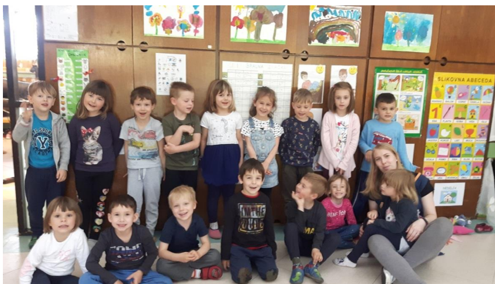
Slika 22: Skupna fotografija

Prav tako sem ponosna, da sem med realizacijo projekta dobila odgovore na vsa zastavljena raziskovalna vprašanja. Odgovori so me pozitivno presenetili, saj nisem pričakovala, da bodo otroci ljudsko glasbo tako dobro sprejeli in jo z veliko željo vključevali v dnevno rutino.