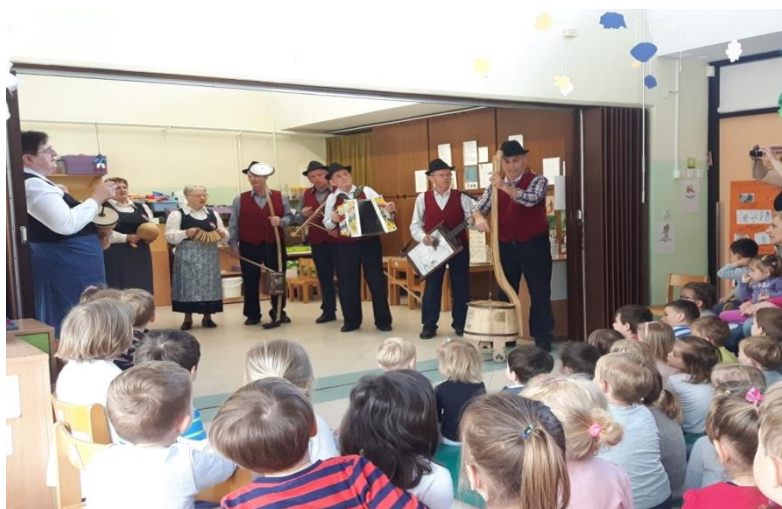
Slika 11: Nastop ljudskih pevk in godcev

Goste smo vljudno sprejeli in prisluhnili njihovem nastopu. Ljudske pevke in godci so se na začetku predstavili. Predstavili so inštrumente, ki so jih prinesli s seboj, in demonstrirali njihov zvok. Zapeli so nam štiri ljudske pesmi, nato so otroke povabili k sodelovanju. Skupaj so poimenovali inštrumente, na željo otrok zapeli pesmi Čebelar, Na planincih sončece sije in Lisička je prav zvita zver ter otrokom dali priložnost, da skupaj z njimi zaigrajo na glasbila. Zatem so otroci gostom zapeli Srečali smo mravljo, ki je niso poznali. Čeprav je nastop trajal dlje, kot sem pričakovala, so otroci ves čas doživljajsko poslušali.