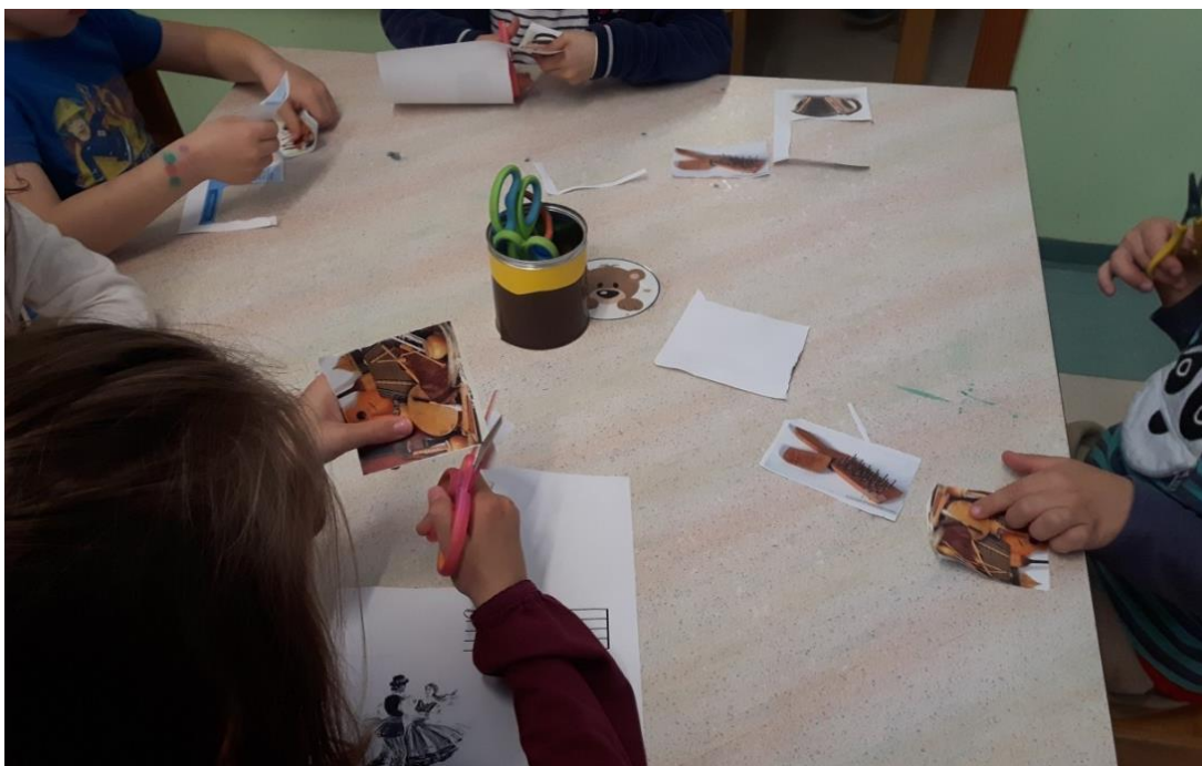
Slika 2: Izrezovanje slik za plakat