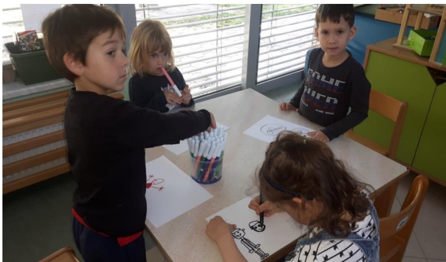
Slika 21: Poustvarjanje ob poslušanju ljudske glasbe

Otrokom sem razdelila balone in njihove pripomočke, ki so jih prinesli od doma. Zahvalila sem se jim za sodelovanje in jih do konca dne opazovala pri igri. Zanimalo me je, koliko otrok bo ljudsko glasbo vključevalo v igro. Kar nekaj jih je med igro uporabljajo instrumente in prepevalo ljudske pesmi, medtem ko je skupina petih deklic izvajala ljudski ples Abraham 'ma sedem sinov. Ljudsko glasbo so vključevali v prosto igro, kar je bil eden od ciljev, ki me je vodil skozi celotno načrtovanje dejavnosti. Ponosna sem, da so ga otroci dosegli.