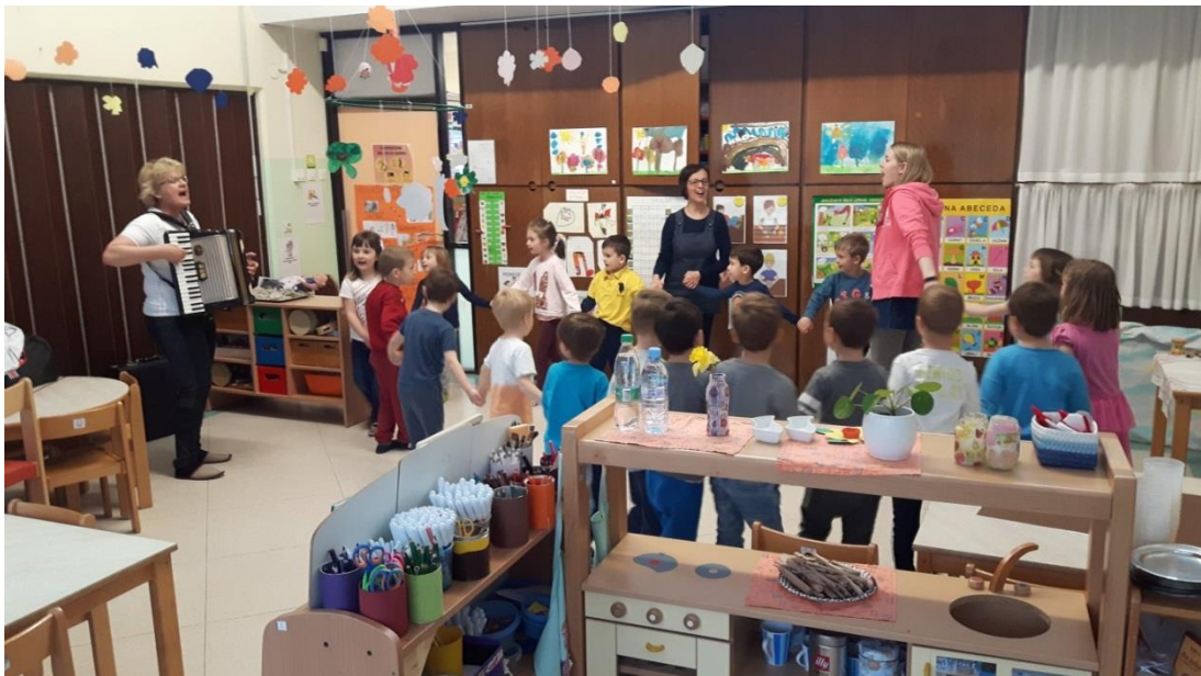
Slika 9: Petje in ples ob zvokih harmonike

Dopoldne smo uredili prostor za knjižnico in razstavo. Otroke sem spodbudila, da lahko še naprej prinašajo inštrumente in podobne reči. Opazila sem, da so zelo ponosni, ko prinesejo stvari v vrtec in znajo o njih tudi veliko povedati. Prav to opažanje lahko povežem z raziskovalnima vprašanjema, kakšen odnos imajo otroci do ljudske glasbe in kako bi jo vključili v dnevno rutino. Do zadnje izvedene dejavnosti lahko ves čas pritrujem, da imajo otroci pozitiven in ljubeč odnos do ljudske glasbe, hkrati pa tudi veliko idej in načinov za njeno vključevanje v dejavnosti.