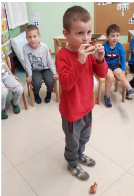
Slika 8: Predstavitev inštrumenta

Eden od dečkov ni prepeval in sodeloval z nami. K temu sem ga spodbudila tako, da sem mu podala roko in ga ves čas spodbujala z neverbalno komunikacijo.