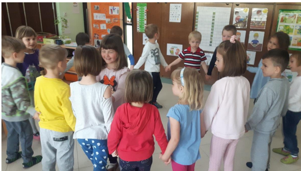
Slika 19: Ljudski ples Bela, bela lilija

Projekt smo zaključili s ponovno izdelavo plakata na temo ljudske glasbe. Otroke sem prosila, naj mi zaupajo svoja mnenja o tem, kaj je ljudska glasba, ter povedo, česa so se naučili o njej. Skoraj vsi so rekli, da je to glasba, ki se prenaša iz roda v rod. Povedali so, da vključuje ljudske pesmi, plese in inštrumente. Našteli so vse pesmi, plese in inštrumente, ki smo jih spoznali, ter omenili, da ljudsko glasbo izvajajo ljudski pevci in godci.