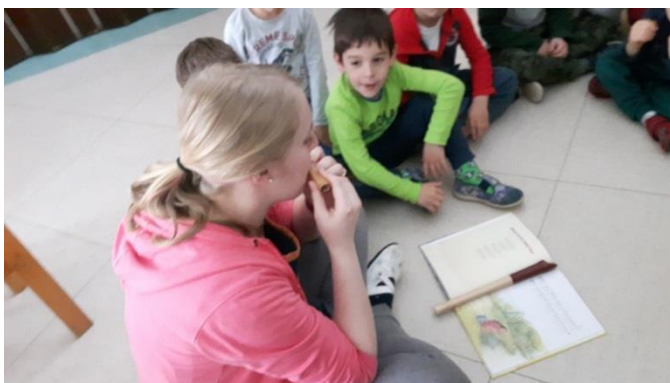
Slika 17: Igranje na nunalco

V jutranjem krogu sem otrokom zastavila glasbeni uganki. Na zlog »la« sem zapela pesem Barčica po morju plava. Polovica otrok je z menoj že pripevala na isti način. Pesem so prepoznali vsi otroci. Skupaj smo jo zapeli. Potem sem na nunalco zaigrala melodijo pesmi Psiček nima repa več. Pesem sem izbrala, ker jo je večina otrok poznala, saj jim jo je vzgojiteljica večkrat prepevala. Spoznala jo je na delavnici Inge Breznik. Skupaj smo jo večkrat zapeli, tako da so jo znali vsi otroci.