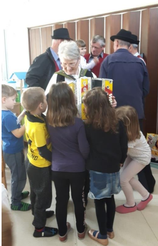
Slika 12: Predstavitev diatonične harmonike

Na začetku projekta sem zastavila tudi raziskovalno vprašanje, kako bo sodelovanje z ljudskimi pevkami in godci spodbudilo otroke k vključevanju ljudske glasbe v dnevno rutino. Otroci so aktivno sodelovali in imeli veliko vprašanj. Zanimali so jih ljudski inštrumenti, njihov odziv je bil izredno pozitiven. Menim, da je srečanje z ljudskimi pevkami in godci otroke spodbudilo k nadaljnjemu razmišljanju in raziskovanju ljudske glasbe.