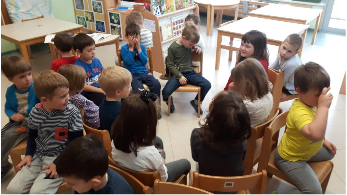
Slika 7: Glasbena didaktična igra Kdo poje?