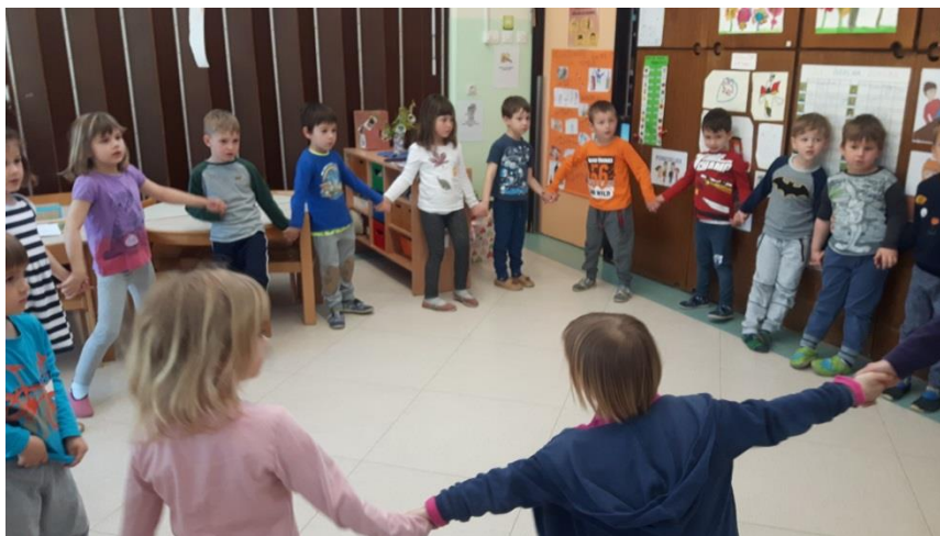
Slika 15: Ljudski ples Rdeče češnje rada jem

V krogu sem na nunalco zaigrala melodijo pesmi Barčica po morju plava. Barčico sem izbrala z razlogom, saj sem pri opazovanju otrok opazila, da jih kar nekaj prepeva to pesem, vendar je kljub temu še ne poznajo vsi. Melodijo je prepoznalo pet otrok. Večkrat sem jo zapela, da je melodija pesmi prišla v uho tudi tistim, ki je še niso poznali, in so vsi začeli pripevati. Pogovorili smo se o pomenu pesmi ter skupaj razvozlali neznane besede. Otroke sem vprašala, na katero glasbilo bi lahko spremljali pesem. Nekateri so predlagali ropotuljico, ostali drdralo. Vzeli so vsak svoj inštrument in se ob petju spremljali. Pesem so hitro usvojili.