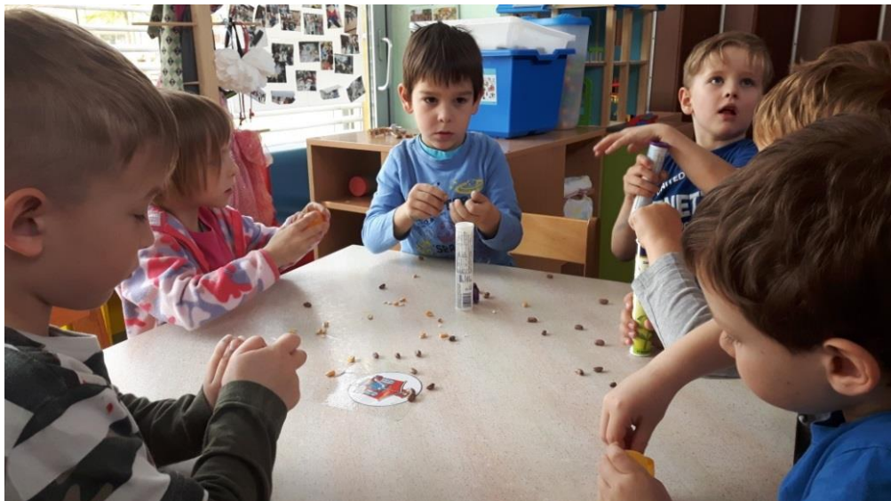
Slika 10: Izdelava inštrumentov

Tokrat sem lahko že bolj natančno opazovala tudi igro otrok. Ugotovila sem, da pridobljeno znanje prenašajo v vsakodnevno igro in dnevno rutino. S tem sem dobila odgovor tudi na tretje raziskovalno vprašanje – ali bodo otroci pridobljeno znanje o ljudski glasbi prenašali v vsakodnevno igro in dnevno rutino.