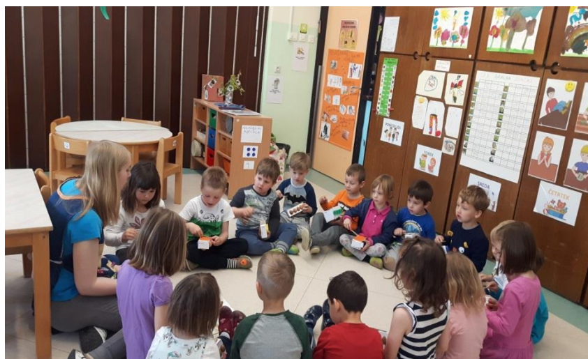
Slika 16: Spremljanje pesmi na inštrumente

V krogu sem na nunalco zaigrala melodijo pesmi Barčica po morju plava. Barčico sem izbrala z razlogom, saj sem pri opazovanju otrok opazila, da jih kar nekaj prepeva to pesem, vendar je kljub temu še ne poznajo vsi. Melodijo je prepoznalo pet otrok. Večkrat sem jo zapela, da je melodija pesmi prišla v uho tudi tistim, ki je še niso poznali, in so vsi začeli pripevati. Pogovorili smo se o pomenu pesmi ter skupaj razvozlali neznane besede. Otroke sem vprašala, na katero glasbilo bi lahko spremljali pesem. Nekateri so predlagali ropotuljico, ostali drdralo. Vzeli so vsak svoj inštrument in se ob petju spremljali. Pesem so hitro usvojili.