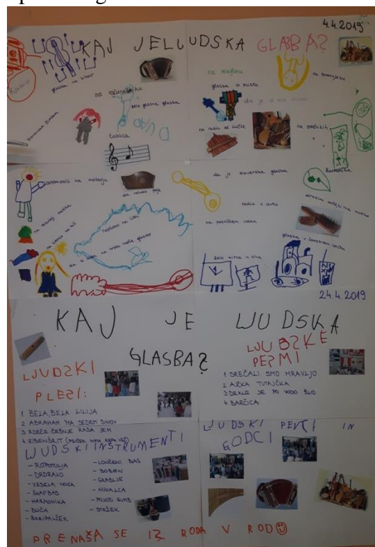
Slika 20: Primerjava plakatov o ljudski glasbi prvega in zadnjega dne projekta

Plakat smo primerjali s tistim, ki je nastal prvi dan projekta. Ko sem jim prebrala takratne odgovore, so se začeli smejati. Eden od dečkov je rekel: »Takrat pa še nismo vedeli, kaj je to, še dobro, da si prišla, da zdaj vemo.« Deklica ga je dopolnila: »Pa lepo je bilo, da so prišli ljudski pevci in godci, da zdaj vemo, kakšne inštrumente so imeli včasih.«