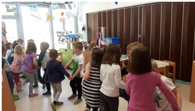
Slika 18: Ples Zibenšrit

Otroke sem spodbudila, da se postavijo v vrsto. Pokazala sem jim korake za ples Zibenšrit. Pri posnemanju so bili otroci večinoma uspešni. Več težav so imeli, ko so se razdelili v pare. Nekateri niso razumeli, da morajo iti v različne smeri, čeprav sva z vzgojiteljico ves čas plesali zraven. Ples smo poskusili izvesti še v krogu. Tukaj otroci niso imeli težav, želeli so si večkrat zaplesati in ponavljati pesem. Nekaj otrok je imelo težave pri usklajevanju petja in plesa. Po večkratni ponovitvi so razumeli koncept in usvojili korakanje ob petju. Navkljub temu, da sem jim tokrat zastavila težjo nalogo, povezano z ljudsko glasbo, so jo pogumno sprejeli in jo želeli obvladati.