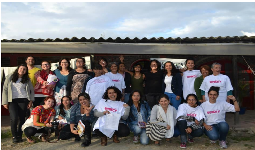
Ilustración 7 Encuentro de las mujeres de la escuela 2014.

El trabajo que se ha adelantado en la escuela se ha llevado a cabo principalmente con mujeres trabajadoras y extrabajadoras de empresas de flores, con quienes hemos emprendido un camino organizativo en el municipio y en la Sabana y con quienes vemos en la Soberanía alimentaria una posibilidad real para las comunidades y un trabajo que puede ayudar a contrarrestar los efectos de la floricultura en el territorio y en la vida de las mujeres. (Archivo proyectos, Asociación herrera, 2014)