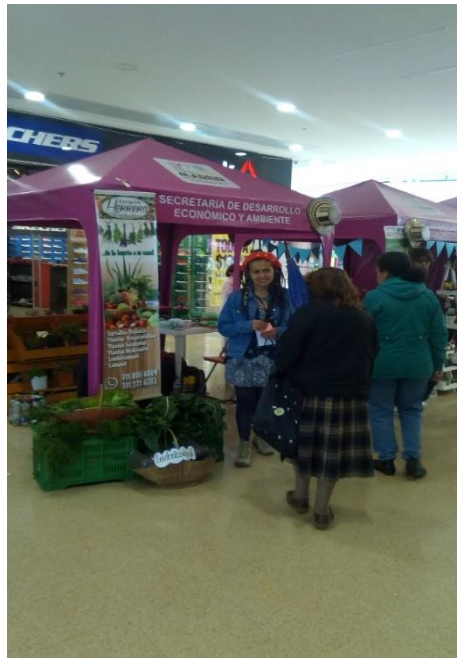
Imagen 9. Feria de emprendimiento Alcaldía de Madrid 2018.

influir en la cultura de consumo, pasa por factores económicos que muchas veces no es reconocido los consumidores en los alimentos sin químicos.