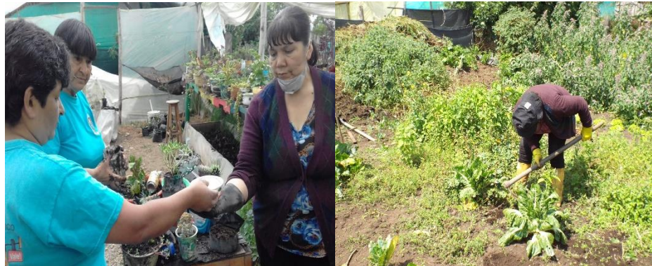
Imagen 8 Ejercicios de minga en el vivero.2018

Dentro del planteamiento de Gúzman la Agroecología se considera como elemento central la matriz comunitaria, que se construye a través de la práctica política y de su identidad, que hacen posibles una red de relaciones sociales.