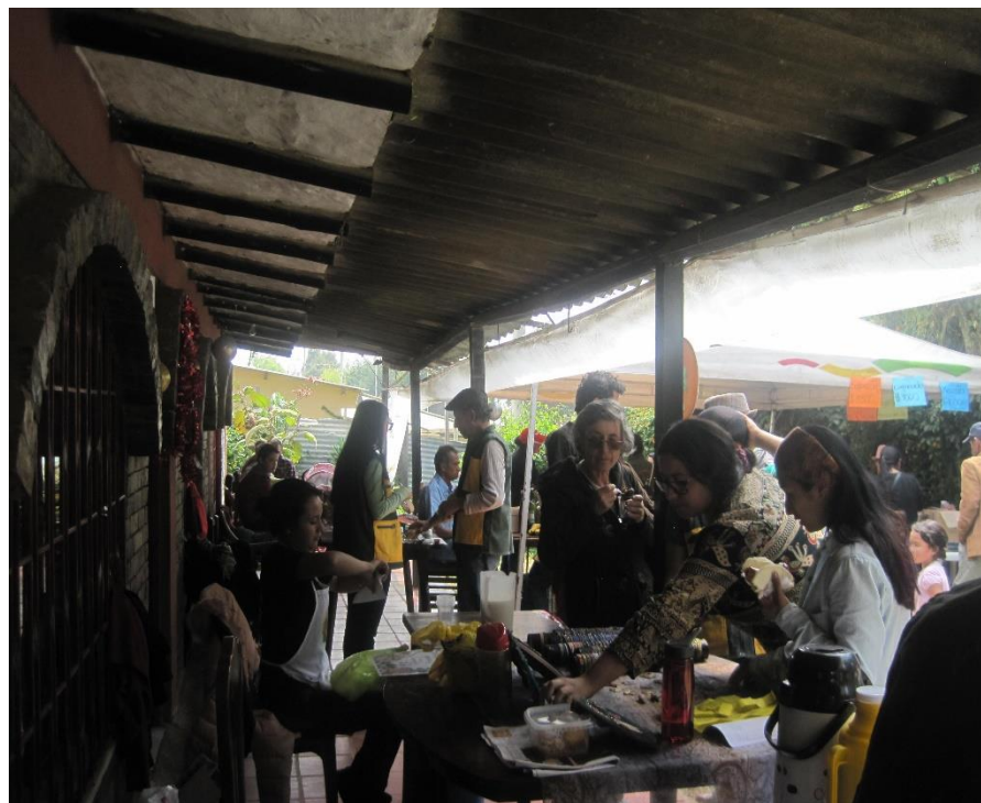
Ilustración 6 Encuentro Urbano Rural 2016.