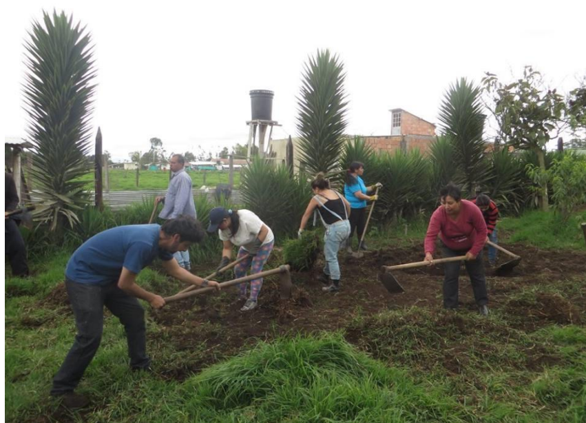
Imagen 6. Minga de trabajo con la red agroecológica, alistamiento del terreno de la huerta la Herrera 2015. (Asociación Herrea, 2017)