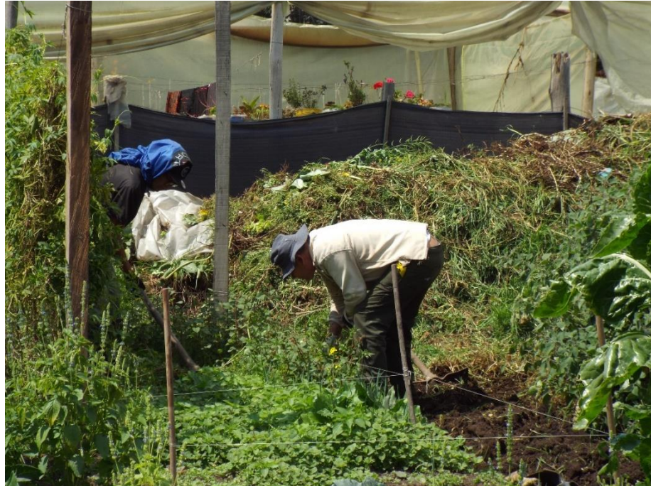
Imagen 7 Ejercicios de minga en la Asociación Herrera.