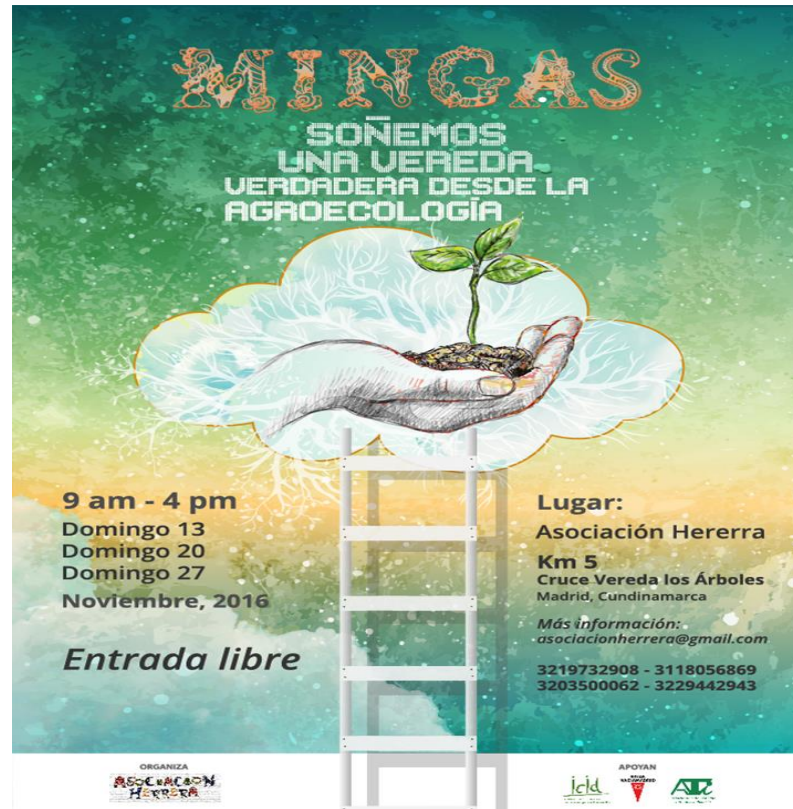
Imagen 4. Afiche sobre la invitación a trabajo de minga. (Asociación Herrea, 2017)

Alrededor de los procesos de la minga se construyen redes de apoyo, las cuales no solo congregan personas que siguen a la organización sino que además posibilita que nuevas manos se sumen al trabajo y sea reconocida por personas de otras zonas que