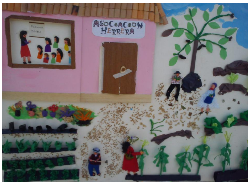
Imagen 1 Creación de una de las integrantes de la Asociación Herrera 2012 .