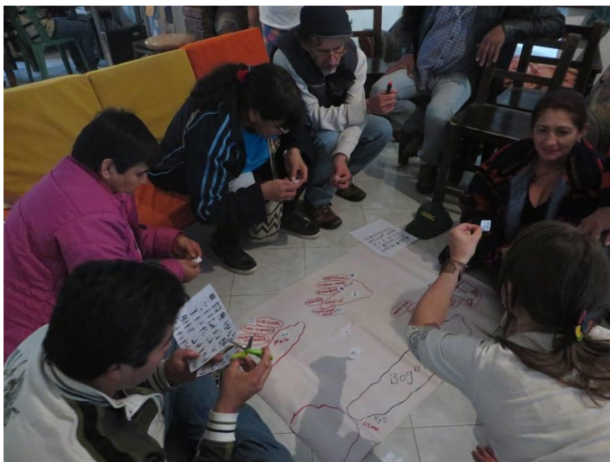
Imagen 5 Ejercicio mapeo colectivo, en el marco del encuentro de la red raíces. (Asociación Herrea, 2017)