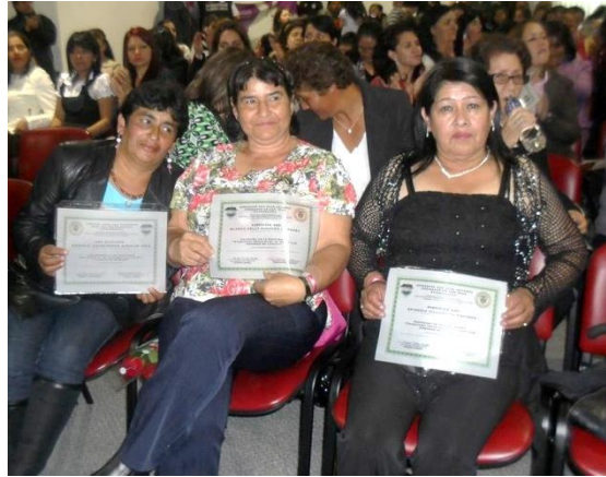
Imagen 11. Proceso de formación escuela de mujeres 2014.

Los vínculos que se construyen especialmente al interior de las organizaciones son los que mayor incidencia tienen en los procesos de construcción subjetiva, son observables y en la medida que afectan el tipo de relaciones, desencadenan proyectos colectivos de mayor solidez.