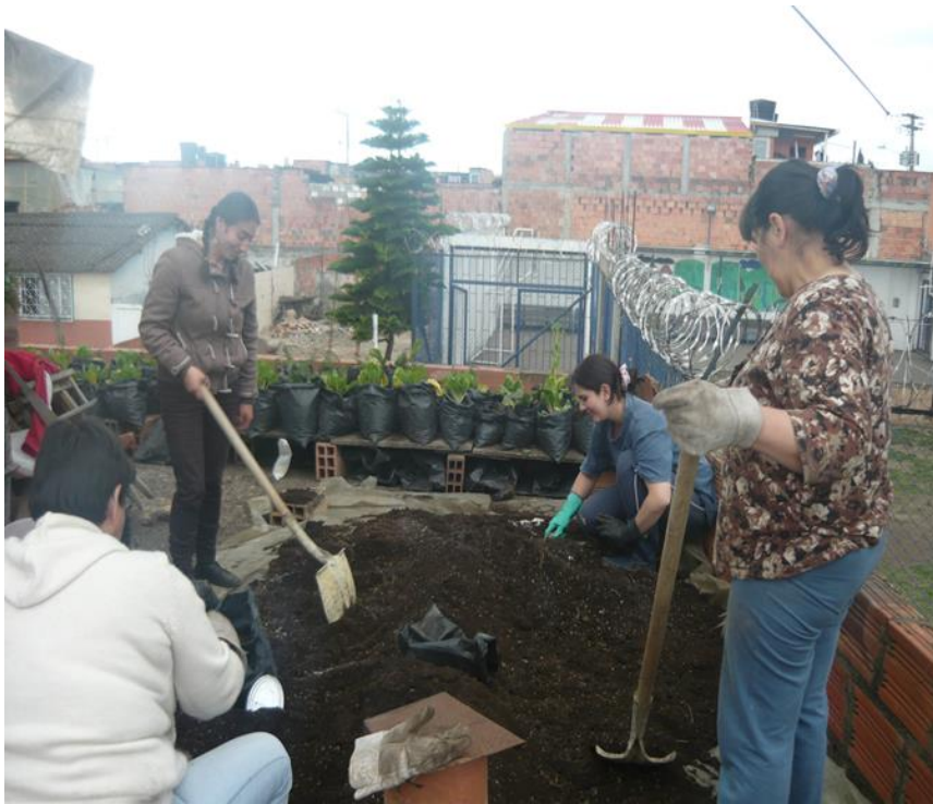
Ilustración 8 Implementación del proceso de las huertas caseras 2014. (Asociación herrera, 2014)