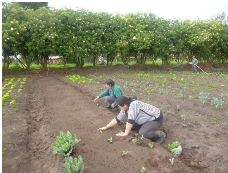
Ilustración 9 trabajo en la huerta comunitaria en comodato. (Asociación herrera, 2014)