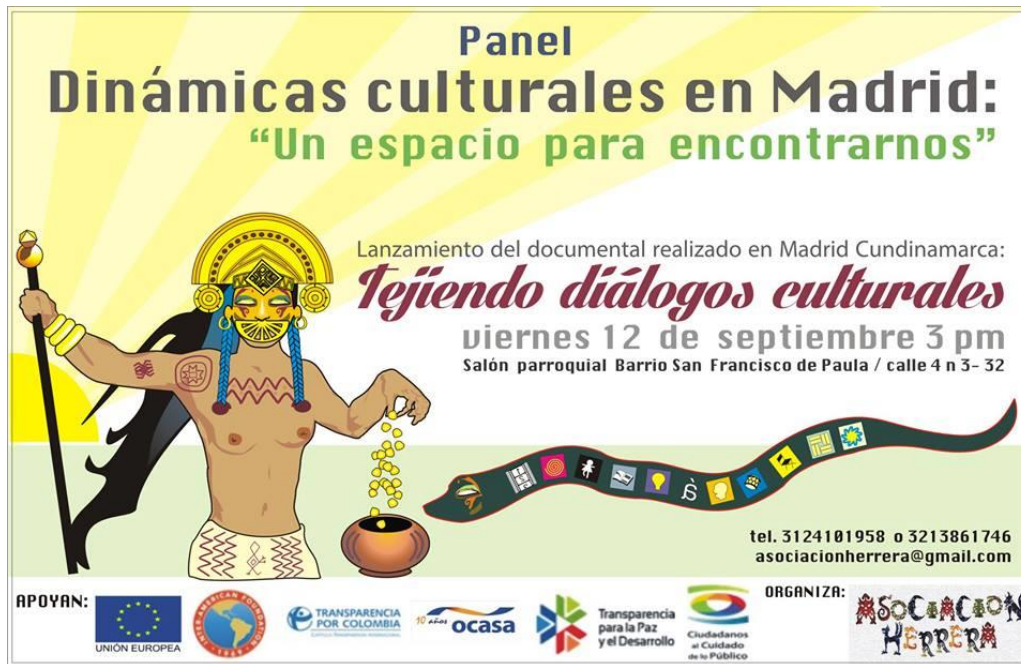
Imagen 2. Muestra documental. Proyecto transparencia para la Paz y el Desarrollo. (Asociación herra, 2014)