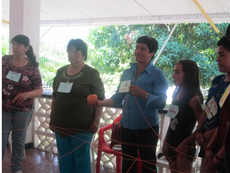
Imagen 2. Encuentro Red por la soberanía alimentaria.