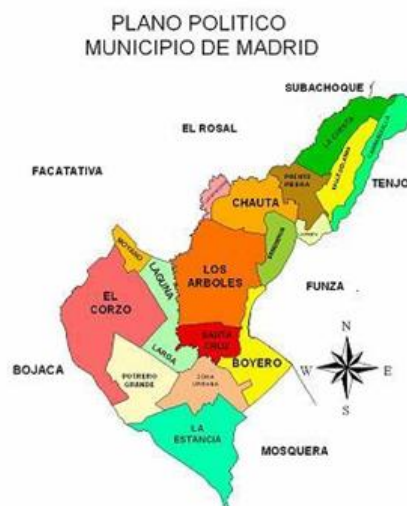
Ilustración 1. Mapa Político Madrid, Cundinamarca. (Página oficial de la Alcaldía de Madrid: 2016).

El municipio de Madrid (Cundinamarca) se encuentra ubicado en la Sabana occidente del altiplano. Limita con los municipios de Facatativá, Mosquera, el Rosal, Soacha, Subachoque y Bojacá. Los cerros de Mondoñedo y la laguna La Herrera conforman el paisaje del territorio