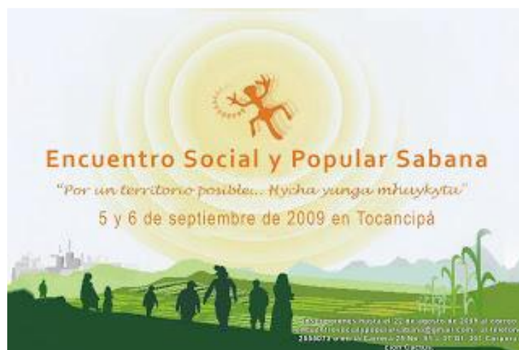
Ilustración 4 Afiche del primer encuentro social y popular sabana ( Asociación herrera, 2014 ).

El Encuentro Social y Popular Sabana (ESPS) se constituye desde el 2007 como espacio de discusión y participación de diversos sectores colectivos, organizaciones sociales, comunitarias y populares de jóvenes, mujeres, estudiantes, ambientalistas, trabajadoras y trabajadores que le apuestan a la construcción del movimiento social en la Sabana de Bogotá. A partir de diversos ejercicios de encuentro, articulación y movilización social se promovió la transformación del territorio para la construcción de condiciones de vida digna para todas y todos sus habitantes.