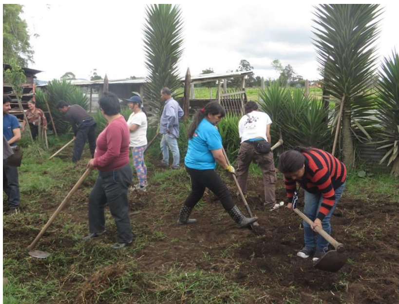
Imagen 2. Minga de trabajo en la huerta comunitaria Herrera.

Dentro de la propuesta se desarrollan clases lideradas por dos de las mujeres que han integrado la escuela, las cuales pasan por varios momentos a continuación se mostraran a partir de la estructura de los proyectos: