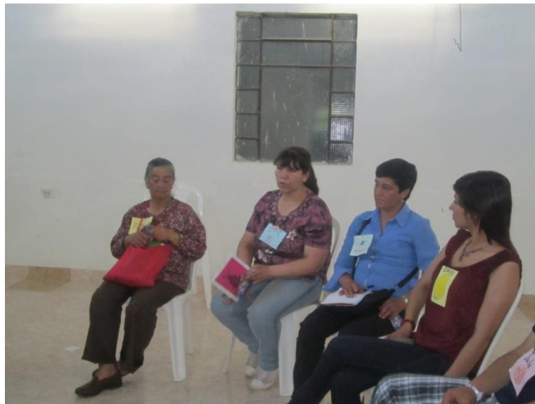
Imagen 3. Socialización Encuentro Red por la soberanía alimentaria.