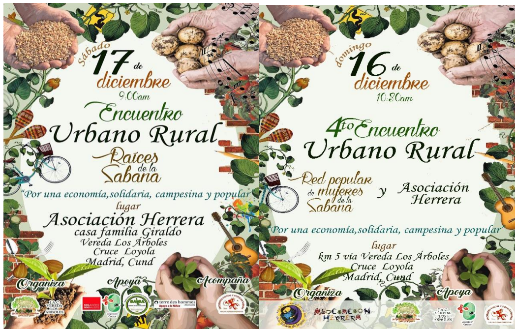
Ilustración 5 Afiches de invitación Encuentro Urbano Rural

Otra de las estrategias son el fortalecimiento de relaciones entre la comunidad rural y urbana que hace parte del territorio de Madrid. Hasta el momento se han realizado tres encuentros. Dentro de su objetivo se busca visibilizar las dinámicas campesinas en el territorio, como los procesos organizativos que se desarrollan alrededor de la soberanía alimentaria.