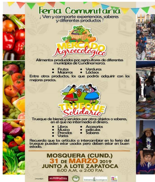
Imagen 10 Afiche Mercado agroecológico 2019.