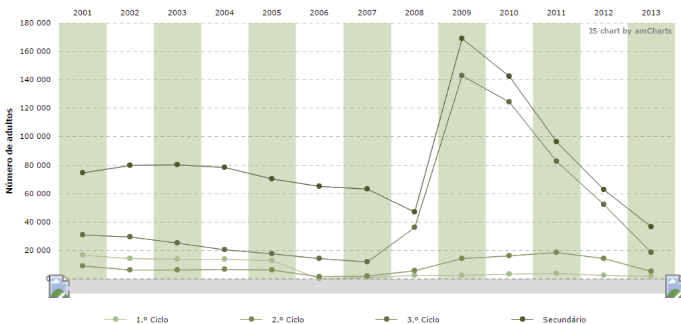
Gráfico 3. Adultos em atividades de educação e formação nos ensino básico e secundário, por nível de ensino e ciclo de estudo, em Portugal (2000/01 a 2012/13)