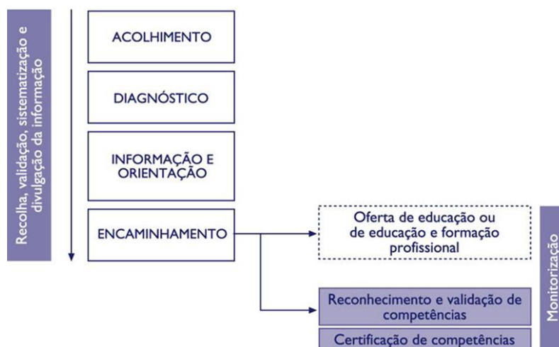
Diagrama 1. Etapas de intervenção dos CQEP