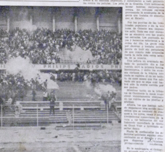
Las Bombas Lacrimógenas Estaban Entre el Público.

El Gobierno suspendió por 30 días las garantías constitucionales en toda la República, a raíz de los trágicos sucesos del Estadio Nacional, y decretó a partir de hoy siete días de Duelo Nacional, sin suspensión de labores. El decreto de suspensión de garantías es el siguiente: Que a raíz de los dolerosos sucesos acaecidos el día de hoy en una actuación deportiva realizada en el Estadio Nacional, se han producido diversos daños que es preciso combatir; Que es deber del Gobierno velar porque dichos sucesos, producidos por la fatalidad y que agobian al Perú todo, no sean utilizados por agitadores que alientan el incalculable propósito de perturbar el orden público; De conformidad con lo previsto en el artículo 79 de la Constitución del Estado; Con el voto aprobatorio del Consejo de Ministros: DECRETÓ: Suspéndase en todo el territorio de la República y por el término de 30 días, las garantías declaradas en los artículos 79, 80, 81 y 82 de la Constitución del Estado. Los Ministros de Gobierno y Policía de Guerra, de Marina y de Aeronáutica quedan encargados de asegurar el cumplimiento del presente Decreto.