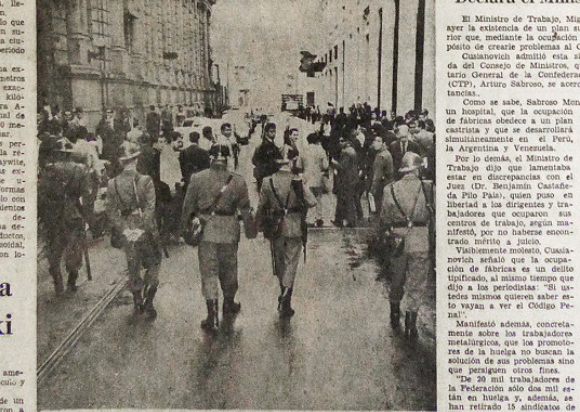
NO FIRMAN, NO ENTRAN.—La Policía impide a los bancarios no firmantes del compromiso de trabajo que aglomeran en la calle al no serles permitido el acceso a sus centros de trabajo.

Un chofer de taxi fue asaltado en Barranco, robándole su vehículo y una gran cantidad de ropa y efectos personales.