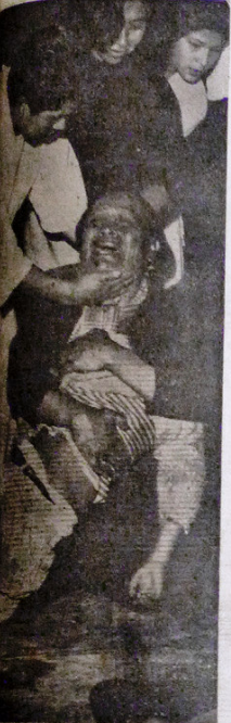
El Muerto, Hijo Mío.