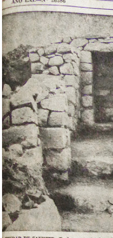
Ciudad de Saywitz. En la meseta donde se halla la famosa piedra de Saywitz se descubrió, bajo tierra y malera, una ciudad que se juzga corresponde al incaico.