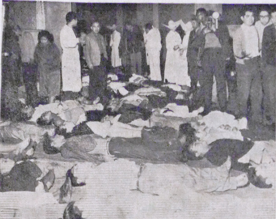
Los Cadáveres Llenaron los Pasillos del Hospital Obrero.