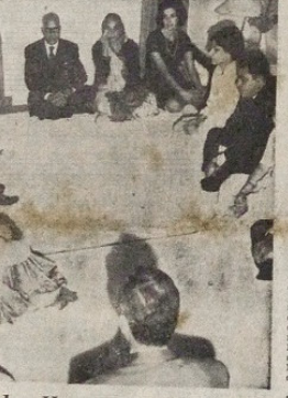
Hindúes Rinden Homenaje a Nehru

En el Hospital de Niños hay sido una gran multitud de niños que se acercaron a despedirse de Nehru. Muchos de ellos lloraban y se desahogaban en sus brazos.