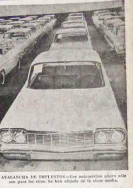
AVANCHA DE IMPUESTOS.—Los automóviles ahora sólo para los ricos. Se han alzado de la clase media.

Los precios de los automóviles han subido un promedio de 31% en solo tres meses, a causa de sucesivos aumentos de impuestos. Las ventas han bajado entre 20 y 40%, por lo que se teme que los ingresos fiscales por importación de automóviles en este año sufrirá alguna disminución, en vez de aumento. Primero fue el alza del impuesto de timbre de 4 a 10% sobre toda mercadería importada; luego un aumento de derechos de 50% sobre toda mercadería importada; luego un impuesto de 18% al tipo, que se aplicó primero a algunas unidades de alto precio y se extendió después hasta a los más insignificantes vehículos; y, por último, una tasa adicional del 1% sobre el Registro Fiscal de Ventas a Plazo. Aparte de esto, en las ventas a plazos, que constituyen el 80% de las operaciones, hay que pagar 3% de intereses sobre los autos. Toda esta avalancha de impuestos ha caído sobre los automóviles en solo tres meses, causando fuerte retraimiento del público.