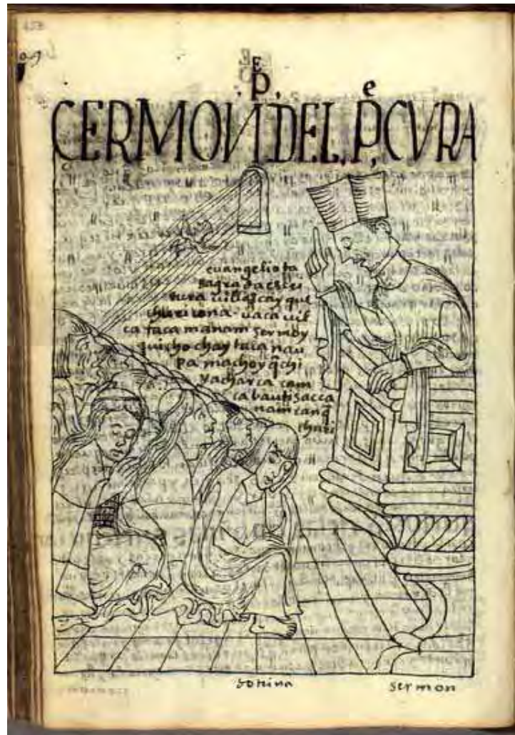
Guaman Poma de Ayala

Dicha puesta en escena parece encarar, de manera arquetípica, el encuentro promovido por los sermones. No sólo porque allí se observa, de perfil, y desde los extremos, la figura del evangelizador y de la población autóctona; sino porque, también, nos sugiere, sobre el diagonal que sirve de puente, la jerarquía presupuesta por la evangelización: El padre desde su púlpito instruye, ilumina y salva a los gentiles (sus hijos).