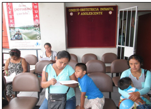
Ilustración 3: Llenado de la encuesta por las madres con hijos de 0 a 36 meses de edad.