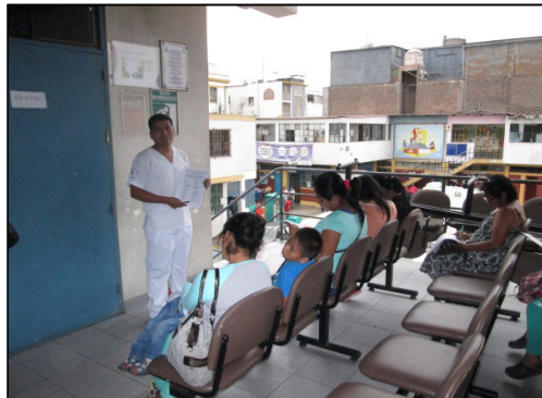
Ilustración 1: Presentación de la encuesta en la sala de espera del Servicio de Dental