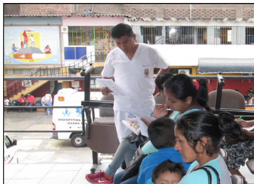
Ilustración 5: Verificación del correcto llenado de la encuesta y entrega de respuestas a manera de charla.