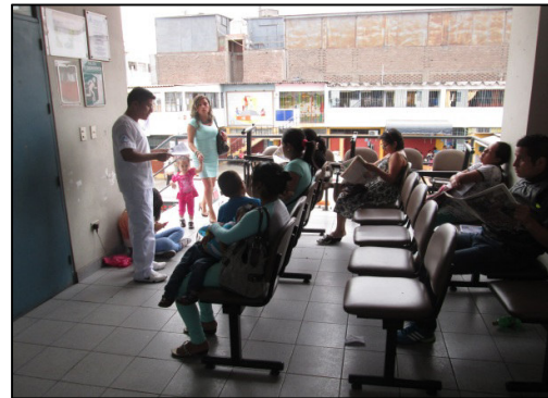
Ilustración 2: Brindando las indicaciones del llenado de la encuesta.