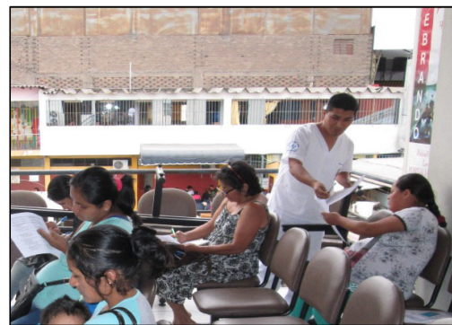
Ilustración 4: Absolviendo dudas de las madres encuestadas.