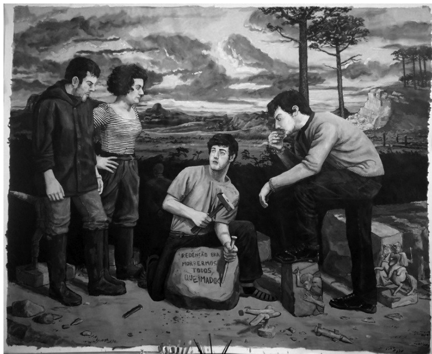
Figura 6 · Tiago Baptista (2010), Redenção era morreremos todos queimados . Acrílico sobre tela, 213x255 cm. Fonte: Tiago Baptista.