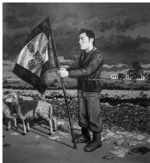
Figura 1 · Tiago Baptista (2010), O Narciso das Fossas . Acrílico sobre papel, 190x150 cm.