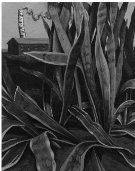
Figura 4 · Tiago Baptista (2011), Sem Título . Acrílico sobre tela, 190x230 cm. Fonte: Tiago Baptista Figura 5 · Tiago Baptista (2013), Untitled . Óleo sobre tela, 30x24 cm. Fonte: Tiago Baptista.