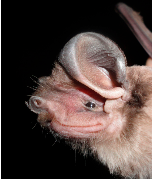
Fig 1. Detalle de la cabeza de un ejemplar macho de Eumops dabbenei capturado en Parque Nacional Copo, Provincia de Santiago del Estero, Argentina.

provincia de Chaco, por Barquez et al. (1999). En Argentina, los registros de la especie son escasos; ha sido citada en Chaco, Salta, Santa Fe, Santiago del Estero y Entre Ríos (De Souza et al., 2008; Barquez y Díaz, 2009). La especie habita en las eco-regiones del Chaco Húmedo, Chaco Seco, Espinal y, marginalmente, Yungas (Barquez, 2006).