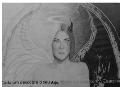
Figura 1 - Exemplo de um trabalho desenvolvido. Ilustração de "Tinha tanto medo de solidão que nem espantava as moscas." de Mia Couto. Fonte: própria.

Figura 2 - Exemplo de um trabalho desenvolvido. Ilustração de "Não é segurando nas asas que se ajuda um pássaro a voar." de Mia Couto. Fonte: própria.