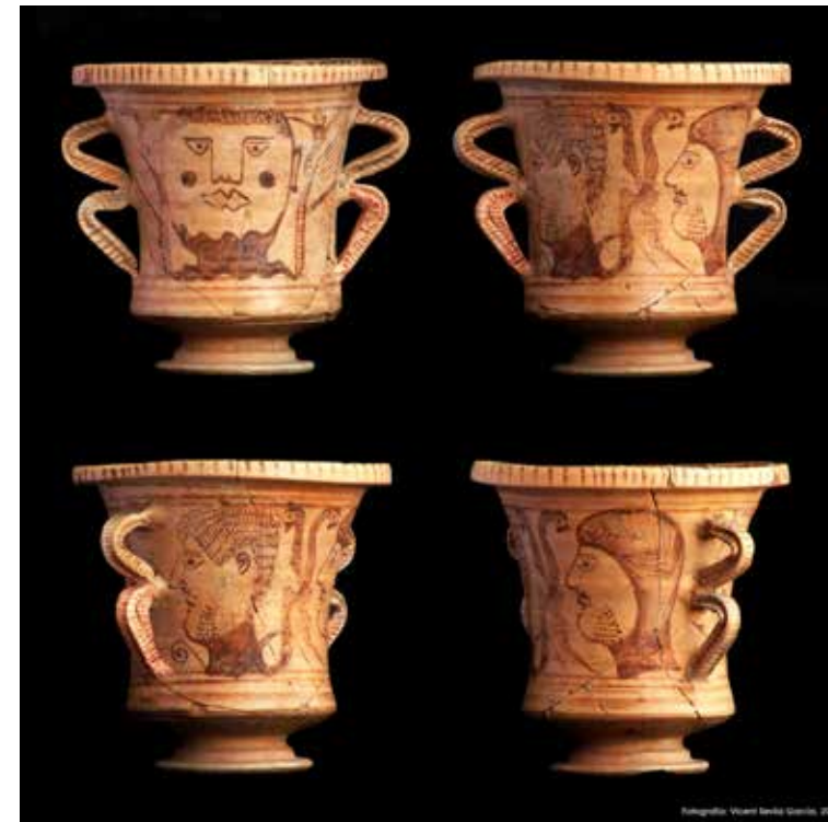
Fig. 6. Diferents vistes del vas conegut com el Cantharus d' Ilici .

Domina Dea Caelestis (ABASCAL 2004: 85), que podria trobar-se fora del recinte forense de la ciutat. Sabem que el fòrum comptava, a més de les estàtues dedicades a August i a l'esmentat patró d' Ilici , Titus Statilius Taurus , amb un enllosat de pedres que fou necessari reparar cap a mitjan segle I d'ne, segons resa en una de les inscripcions recuperades (ABAD-ABASCAL 1992: 84, núm. 5; CORELL 1999: 62, núm. 10; ABASCAL 2004: 80-81), i amb diverses plaques de bronze en les seues parets –com la comentada sobre el repartiment de las terres de la colònia o la que menciona els funerals de Druso (RAMOS FERNÁNDEZ 1975: 277-278; ABAD-ABASCAL 1992: 82-84, núm. 4; CORELL 1999: 67-69, núm. 13; ABASCAL 2004: 86-87)–. En resum, aquesta ciutat romana degué concentrar dins del perímetre amurallat els edificis més emblemàtics i representatius de la colònia i potser, exceptuant les magnífiques cases dels sectors 3F i 5F, haurem de buscar els espais de vida domèstica fora d'aquests murs.