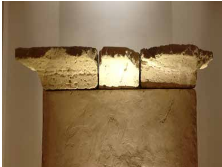
Fig. 3. Motlures exposades a la sala Iberia del museu de l'Alcúdia.

24 A les dades exposades, hem de sumar les restes d'una altra necròpolis ibera localitzada a uns 500 m a l'est de l'Alcúdia, a la coneguda hisenda Botella (En el umbral 2001; DE MIGUEL et al. 2002).