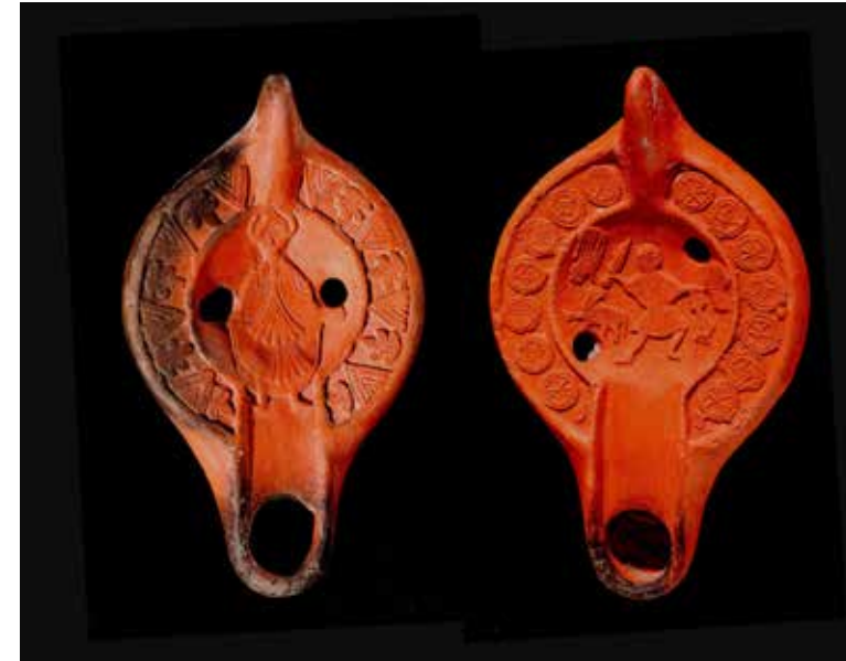
Fig. 8. Llànties del segle VI amb les representacions de sant Abdó i del sacrifici d'Isaac.

2006: 71 i s.; SARABIA-CANAVATE 2009), o amb aparells més sòlids com els del sector 4C (TENDERO-RAMOS 2012).