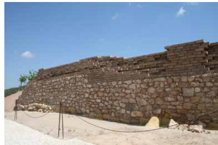
Fig. 5. La muralla d' Ilici . Vista parcial d'un tram del seu parament.

i les terres limítrofes per l'oest –superior als 5 m d'alçada–, per un costat afectaren profundament la conservació, però, per un altre, deixaren seccionat el nucli de la fàbrica, cosa que proporcionà una immillorable lectura del seu interior i, per tant, de la seua construcció. S'hi observa, així, que, seguint els diferents plànols escalonats sobre els quals s'assenta la cimentació del llenç, existeixen trossos modulats en què es feren servir grans aportacions de terra com a farciments de la muralla, i no pas pedra. 31 D'aquesta manera tan enginyosa els artífexs d'aquesta gran obra proporcionaren una major flexibilitat a la construcció i economitzaren el treball de la pedra, tan escassa en el territori immediat. 32