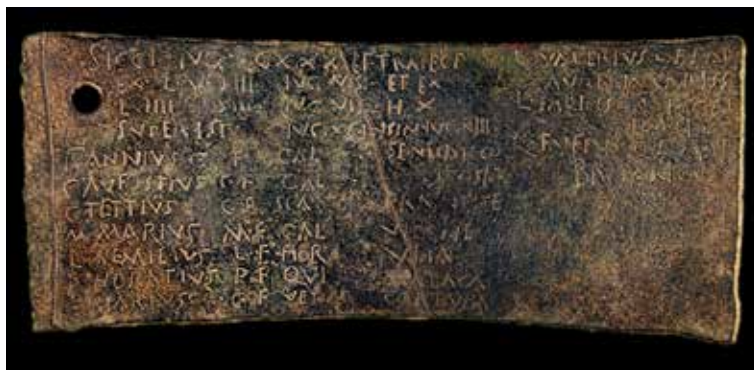
Fig. 4. Fragment de bronze conegut com la Tabula d'Ilici .

d'un document més gran en què es refereix el cadastre efectuat amb la segona deductio o repartiment de les terres properes a la colònia. En la peça conservada, de forma rectangular i amb un orifici en l'extrem superior esquerre, amb la finalitat de ser penjada probablement en una de les parets del fòrum, s'hi esmenta el repartiment de finques entre deu nous colons, identificats amb el seu praenomen , nomen , filiació –amb el nom del pare– i el lloc de procedència. Aquest document, sumat al fet de tenir identificada arqueològicament la colònia i fossilitzat en el paisatge del Camp d'Elx la retícula amb els eixos de l'ordenació parcel·laria des d'època romana, converteixen Ilici en un enclavament únic dins de l'Imperi romà (TENDERO et al. 2014: 231) i en una de les ciutats receptores de l'impuls polític que August fomentà sobretot en els primers moments del principat (MARTÍN-BUENO 1999: 118). La ubicació d'una seca a Ilici (LLORENS 1987; RIPOLLÉS 2004; ABASCAL-ALBEROLA 2007), la probable construcció o remodelació del fòrum colonial –del qual per ara no en tenim constància en el registre– o de la muralla, fan d'aquest enclavament un espai significatiu del qual, tanmateix, a penes tenim dades arqueològiques.