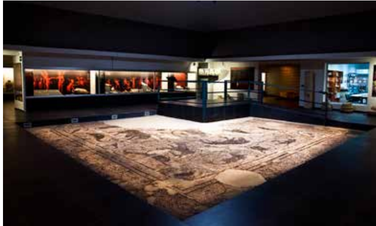
Fig. 7. Vista general de la sala Hispania del museu de l'Alcúdia.

notícia d'A. Sánchez Cabañas en Historia Civitatense , 36 en el segle XVIII es trobaren les restes de la cimentació d'un amfiteatre de forma el·líptica del qual hui per hui només s'intueix una empremta en el paisatge.