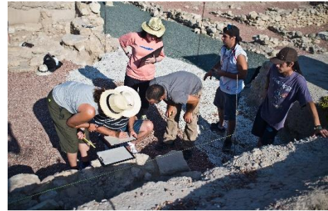
Planimetrías y alzado de estructuras