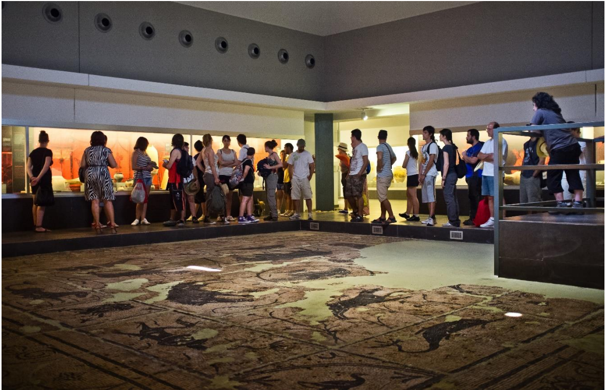
Visita al Museo de L'Alcúdia