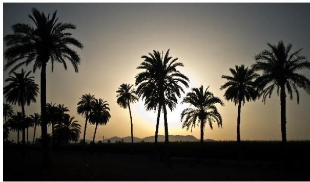
Visita al Palmeral de Elche, Patrimonio de la Humanidad