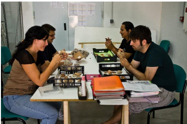
Clasificando los materiales recuperados en la excavación