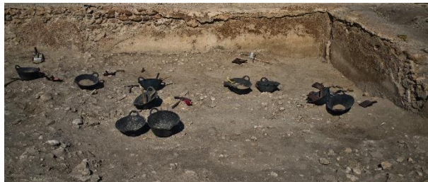
Zona de trabajo después de una dura jornada de campo