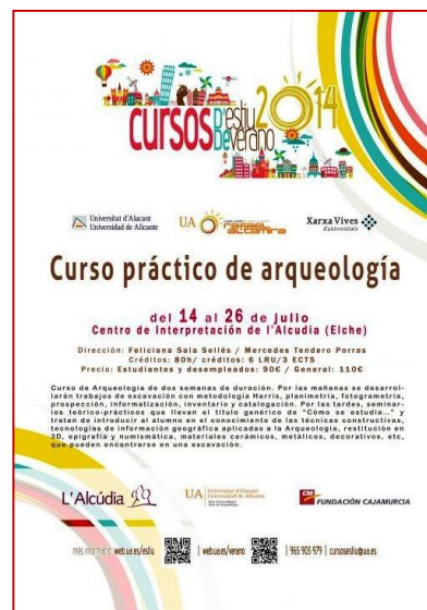
Folleto anunciador del curso