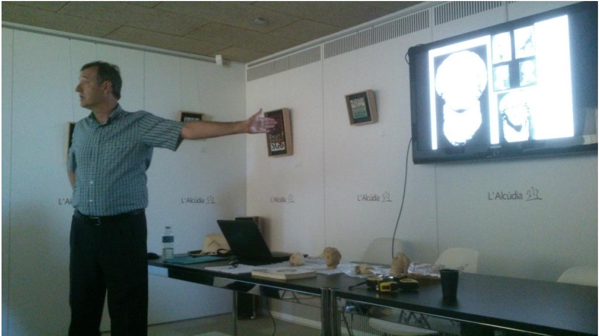
Seminario sobre escultura romana