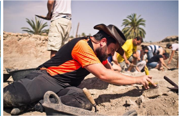
Participantes tomando cotas de profundidad y limpiando los estratos arqueológicos que se excavaron