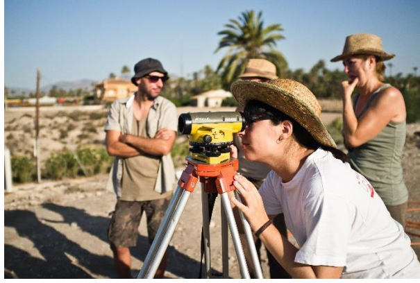
Tomando cotas de profundidad y montando los aparatos de nivelación