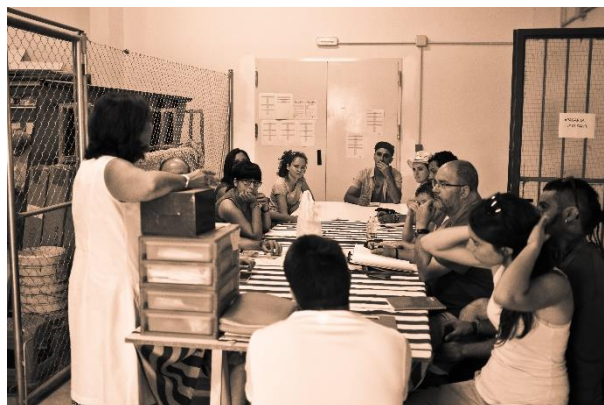
Sesión de trabajo en el laboratorio de arqueología

Los grupos de trabajo establecidos permitieron que el número de alumnos por sesión y práctica fuese asequible e idóneo para conseguir un trato casi individualizado y acorde con el compromiso docente que pretendía el curso. La rotación de los grupos por todos y cada uno de los espacios destinados a la realización de las prácticas (laboratorios, almacén de arqueología, salas preparadas para digitalización, dibujo, etc), permitieron el correcto desarrollo de los objetivos propuestos.