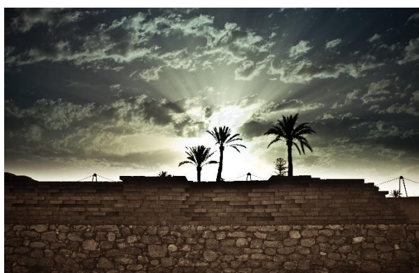
Vista de la muralla romana de Ilici

El curso se desarrolló en el yacimiento arqueológico de L'Alcúdia , solar de la antigua ciudad de Ilici . Este enclave resultó un escenario idóneo para el curso puesto que aquí se ubicó un importante asentamiento durante la época ibérica; una colonia romana, la Colonia Iulia Ilici Augusta y, posteriormente, la Sede episcopal ilicitana en tiempos de los visigodos. En la actualidad, la gestión, difusión e investigación que se difunden a partir de este importante parque arqueológico de la Comunidad Valenciana, están regulados por la Fundación L'Alcúdia .