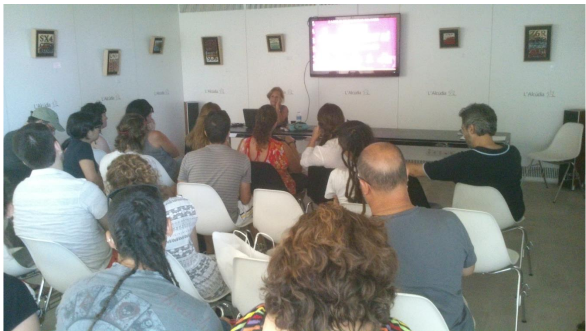
Seminario sobre el vidrio romano