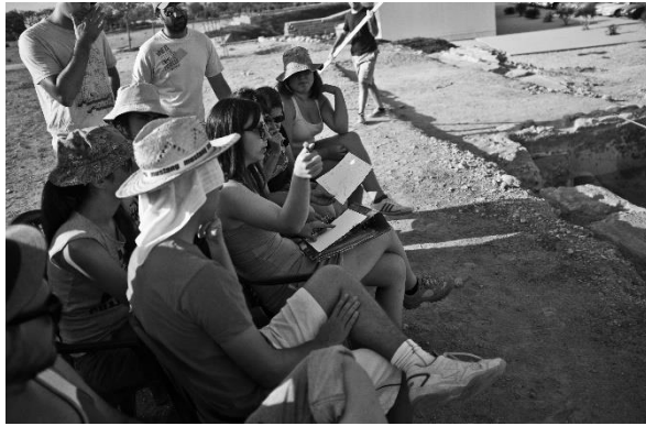
Diferentes detalles de los trabajos de campo: realización de fichas, secciones acumulativas, cribado, etiquetas y separación de materiales arqueológicos, charlas sobre conceptos de estratigrafía, etc.