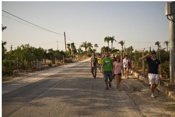
De paseo por un ramal de la Via Augusta a su paso por Ilici