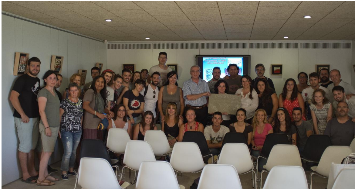
Acto de clausura del I Curso Práctico de Arqueología. Julio 2014