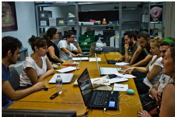
Alumnos realizando una práctica de digitalización en una de las salas habilitadas con dispositivos informáticos

El conjunto arqueológico comprende de un Centro de Interpretación , donde se encuentra la zona de recepción turística, la tienda, una sala de exposiciones, una sala didáctica y otra de audiovisuales; un Museo , en el que se ubican, además de las salas expositivas, el laboratorio y almacén de arqueología, el laboratorio de restauración y diferentes despachos de trabajo y, por último, el propio yacimiento arqueológico , compuesto por 10 hectáreas de terreno atravesado por sendas acondicionadas y provistas de arbolado, que comunican los diferentes espacios exhumados durante más de siete décadas de excavaciones. Tanto las instalaciones como sus contenidos materiales y arqueológicos, resultaron idóneos como complementos para el buen desarrollo del curso .