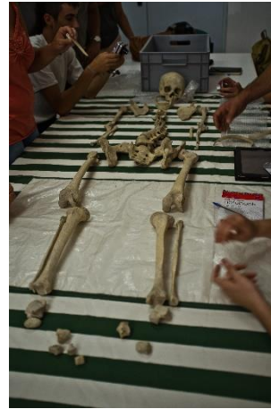
Sesiones complementarias sobre antropología física en el laboratorio de arqueología, en las que se analizaron los restos humanos de un enterramiento visigodo encontrado en la necrópolis ubicada junto al ábside de la basílica