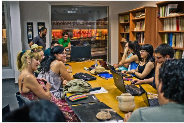
Prácticas de dibujo y fotografiado de materiales arqueológicos