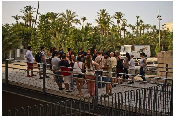
Explicación desde una de las entradas a la ciudad islámica de Elche, junto a parte de los lienzos de la muralla del siglo XI conservada

Terminado el curso, los participantes rellenaron una encuesta anónima estimando las diferentes actividades que se habían realizado durante estas dos semanas así como algunos de los aspectos complementarios. En líneas generales, los recursos más valorados han sido todos aquellos en los que se realizaron sesiones prácticas , tanto en el campo –excavación, dibujo–, como en las salas habilitadas o laboratorios. Los seminarios de la tarde han sido gratamente asimilados ya que ampliaron los conocimientos teóricos y facilitaron la comprensión de muchos aspectos que se desarrollaban durante las tareas matinales.