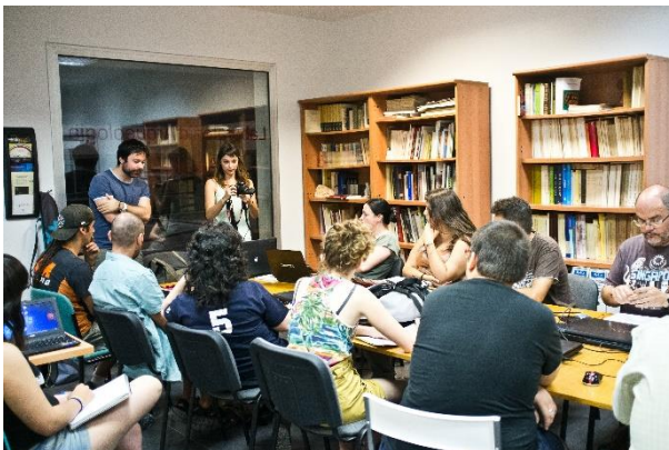
Práctica de restitución tridimensional