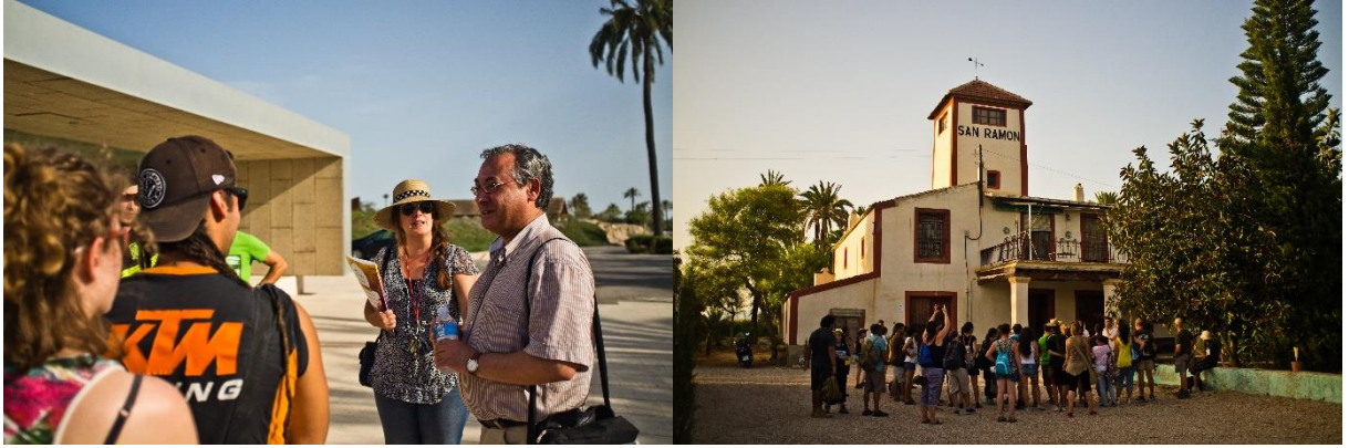
Visita guiada por la centuriación romana y explicación de los recursos del Campo de Elche