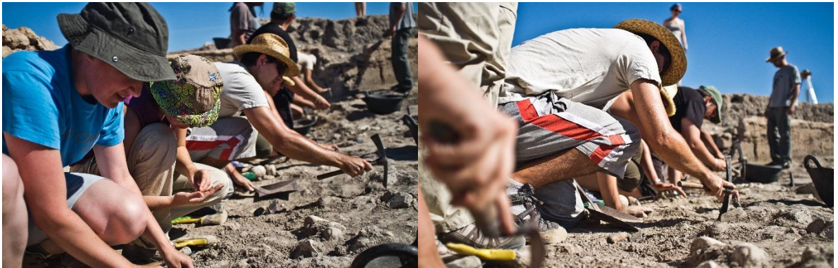
Trabajos de arqueología de campo en el interior de la natatio de las Termas Occidentales, uno de los lugares en el que se realizaron las prácticas.

Los grupos de trabajo establecidos permitieron que el número de alumnos por sesión y práctica fuese asequible e idóneo para conseguir un trato casi individualizado y acorde con el compromiso docente que pretendía el curso. La rotación de los grupos por todos y cada uno de los espacios destinados a la realización de las prácticas (laboratorios, almacén de arqueología, salas preparadas para digitalización, dibujo, etc), permitieron el correcto desarrollo de los objetivos propuestos.