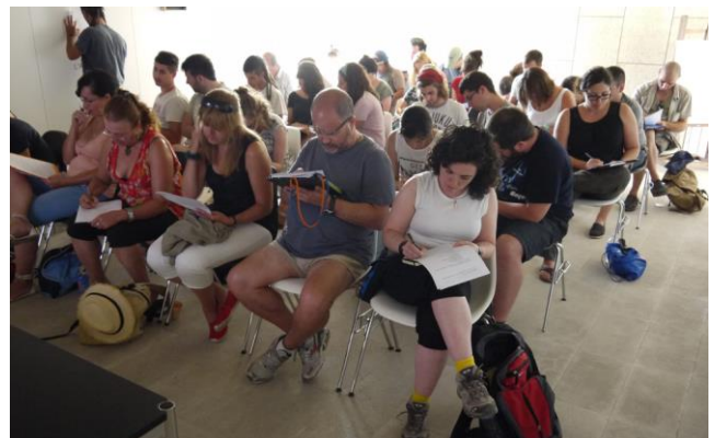
Conferencias de los seminarios de las tardes