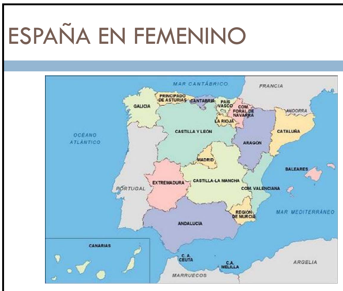
Figura 2. Anverso ficha.

La primera ficha, titulada España en femenino se muestra a continuación (Fig. 2 y 3).