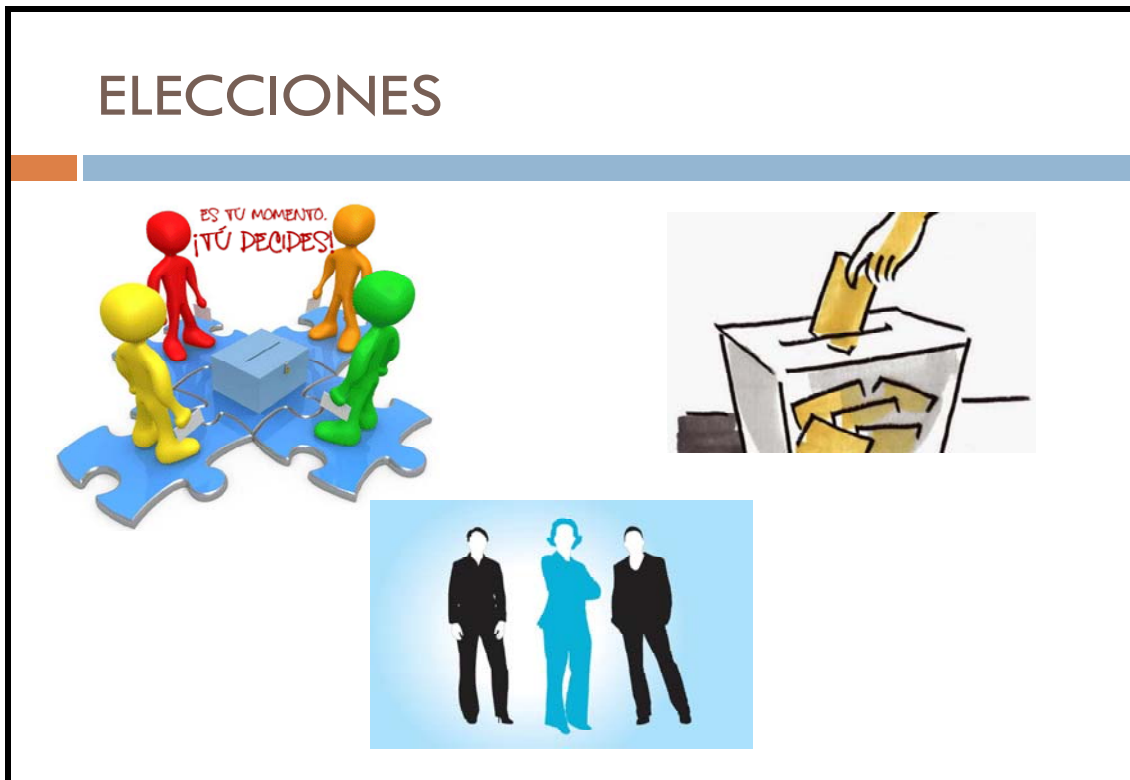
Figura 6. Anverso ficha.