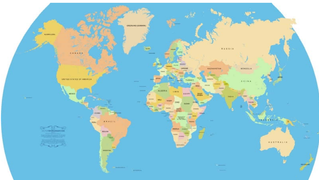
Figura 4. Anverso Ficha