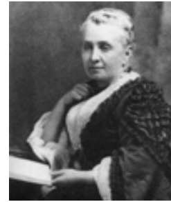
Figura 3. Isabella Bird.

Es la viajera de la época victoriana por excelencia. No comenzó a viajar hasta que alcanzó los cuarenta años de edad, tras fallecer sus padres, de los que se había tenido que hacer cargo. Un doctor le prescribió que viajara para curar sus males, y ella se convirtió en adicta a viajar. Durante su carrera itinerante, Isabella visitó y escribió acerca de numerosos países por todo el mundo.