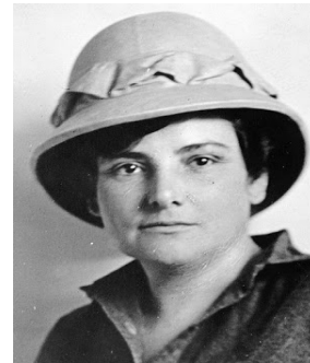
Figura 4. Harriet Chalmers.

Destacamos sus trabajos en América del Sur (los Andes y el altiplano boliviano), Asia y el Pacífico Sur, en total más de cien mil millas, escribiendo para la National Geographic. Cuando, a los 50 años, quiso ingresar en la Sociedad Geográfica Nacional se encontró las puertas cerradas por ser mujer y decidió fundar la Sociedad de Mujeres Geógrafas. Su incansable empeño en demostrar que las mujeres pueden ir a cualquier sitio y afrontar los mismos riesgos que los hombres la incluyen entre las pioneras en este campo del conocimiento, destacando su peculiar visión del mundo desde una perspectiva femenina diferente, como se puede apreciar en la fotografía "la maternidad en Filipinas".