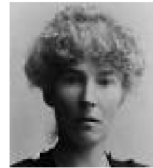
Figura 5. Gertrude Bell.

Nació el 14 de julio de 1868 en el condado inglés de Durham. Cuando tenía dieciséis años, su padre, la envió a estudiar al prestigioso colegio femenino londinense Queen's College. Allí Gertrude demostró ser una estudiante modelo y destacó hasta tal punto que su profesor de historia le propuso continuar sus estudios en Oxford, un lugar muy poco común para una mujer y donde su estancia académica no estuvo exenta de comentarios machistas por parte de profesores y estudiantes.