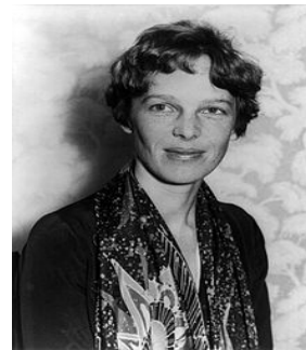
Figura 6. Amelia Earhart.

La NASA como ocurrió con la Real Sociedad Geográfica de Londres en un principio no aceptó mujeres, hasta 1978 en que pudieron colaborar en aventuras espaciales. Los expertos aseguraron, por fin, que no encontraban razones biológicas que limitaran el acceso de las mujeres a estos viajes.