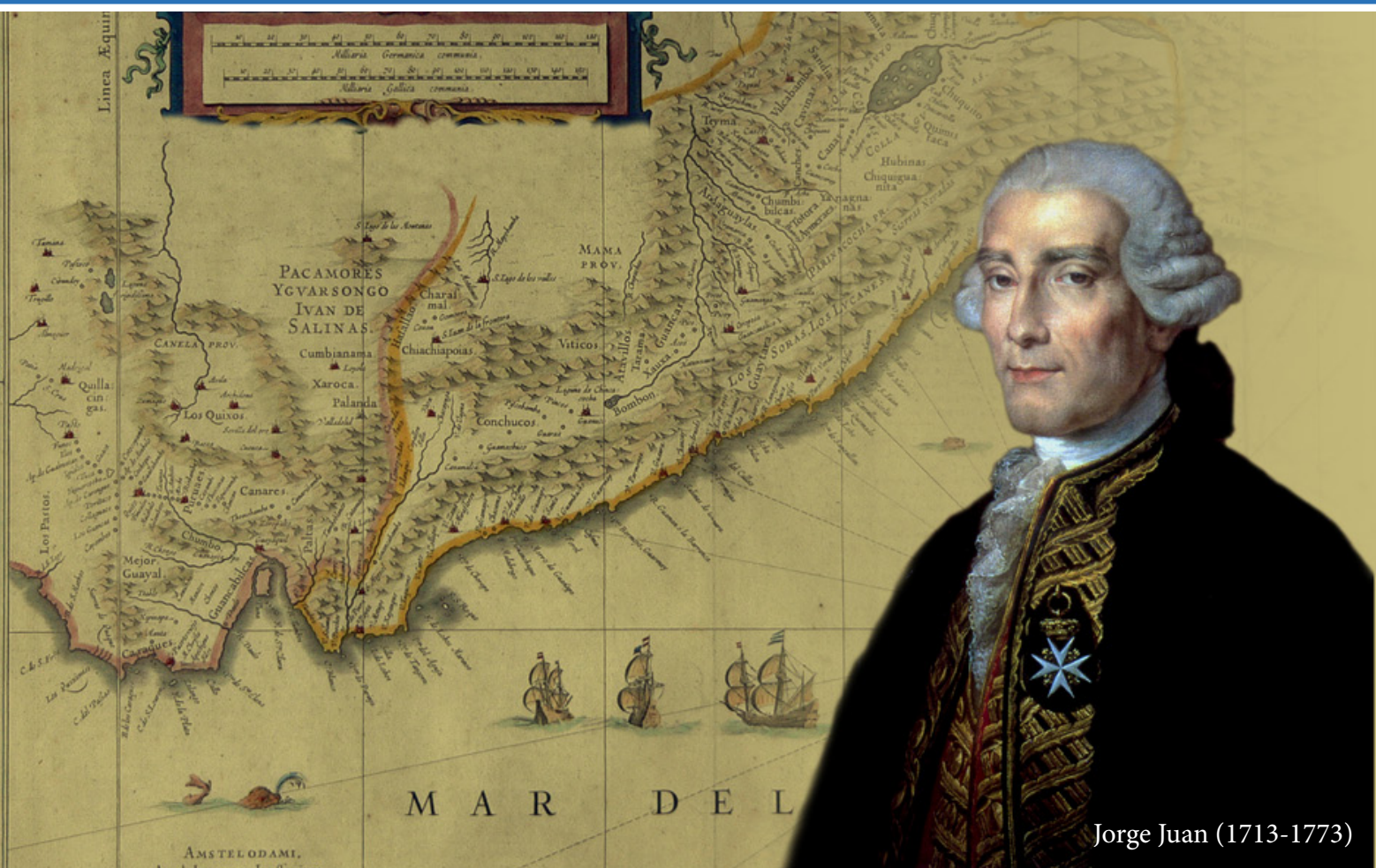
Jorge Juan (1713-1773)