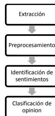
Figura 1. Modelo para minería de opiniones.

La fase identificación de sentimientos trabaja con el texto ya normalizado, y lo que busca es identificar dentro de la opinión las características esenciales que permitan descubrir seguidamente el sentimiento asociado. Aquí se etiqueta morfológicamente cada palabra con su respectiva categoría gramatical (verbo, adjetivo, adverbio, nombre etc.). Una vez hecho el etiquetado se toman para la clasificación todas aquellas palabras en las categorías de verbo, adjetivo o adverbio.