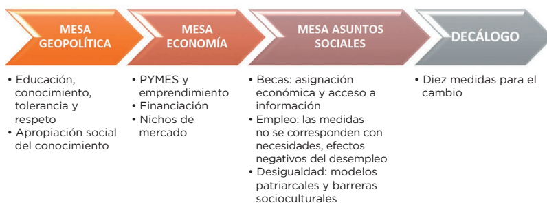
Figura 1.- Principales conclusiones simulación reunión G20

A partir de los resultados obtenidos en este evento basado en el ABP, se propone un decálogo de medidas, claramente enfocadas al cambio social en la esfera global y especialmente destinadas al colectivo joven: