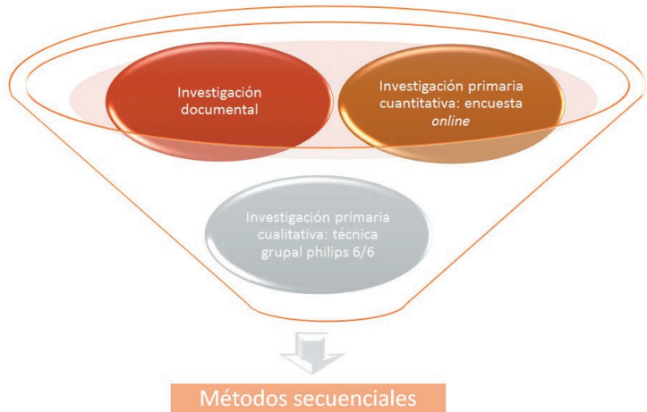
Figura 1.- Diseño metodológico

Siguiendo a Mariño (2006), la planificación y organización del evento se ha basado en una estrategia de triangulación metodológica que permite un abordaje pertinente del objeto de estudio y, en el caso que nos ocupa, también permite gestionar la propia organización del evento. Se plantea, en este sentido, el uso de una triangulación entre métodos secuenciales que consiste, tal y como señala Arias (2000), en el uso de varias técnicas de investigación de forma sucesiva que se aplican apoyándose en los resultados de las técnicas precedentes. El diseño metodológico se basa en técnicas de investigación primarias (cuantitativas y cualitativas) y secundarias.