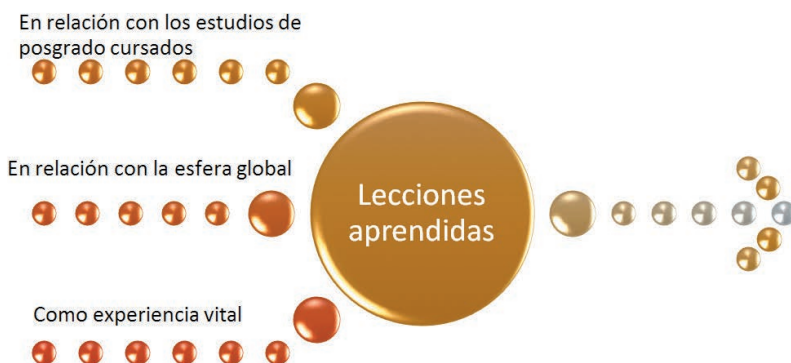
Figura 2.- Lecciones aprendidas en el proyecto Encuentro Internacional de Jóvenes para la simulación de una reunión del G20 -Diálogo, visión y participación activa de jóvenes sobre prioridades del G20 en materia de políticas públicas de juventud-

En relación con los estudios de posgrado cursados , ha sido una forma innovadora de poner en práctica, durante las diferentes fases del proyecto, la metodología docente de las diferentes asignaturas del máster; el proyecto ha permitido obtener una perspectiva amplia, real, profunda y práctica de la comunicación persuasiva, la co-orientación y las relaciones institucionales; aplicar el modelo de co-orientación con los participantes en