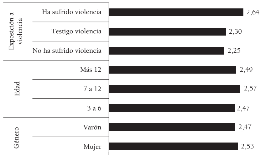
GRÁFICO 2. Evolución escolar en el centro según edad, género y exposición a la violencia

investigadores y profesionales, como son las dificultades escolares con las que se pueden encontrar, entre un abanico más amplio de repercusiones, los menores que han vivido situaciones de violencia de género perpetrada por el compañero íntimo de la madre en sus hogares.