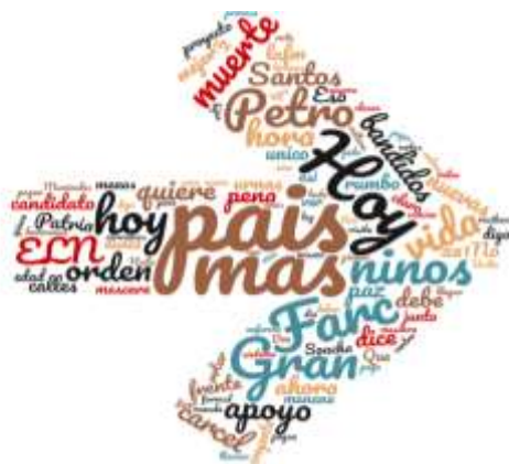
Ilustración 1 7

Así pues, el resultado tras el análisis del contenido de los tweets de Ordoñez, fue de un valor de sentimiento de 2.2, esto indica una polaridad relativamente positiva, sin embargo muy cercana a la polaridad positiva bastante cercana a la neutralidad; esto también se refleja en el porcentaje de aceptación que es de apenas un 62%.