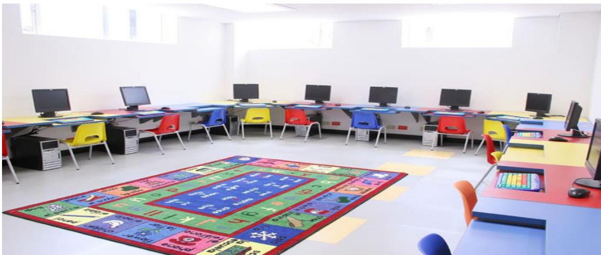
Figura 5. Modelo de referencia del salón de Informática, con pc´s especiales para el aprendizaje de los niños