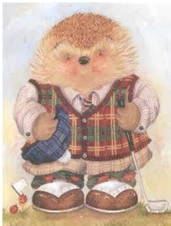
Figura 1. Mecky, es la imagen de un Puerco Espín tradicional de la cultura alemana

En el marco del planteamiento estratégico, aunque no es parte del estudio aquí propuesto, los profesores y personal administrativo de la institución serán parte societaria del preescolar, que permitirá que la rotación, el compromiso y la calidad de los empleados se la más alta posible.