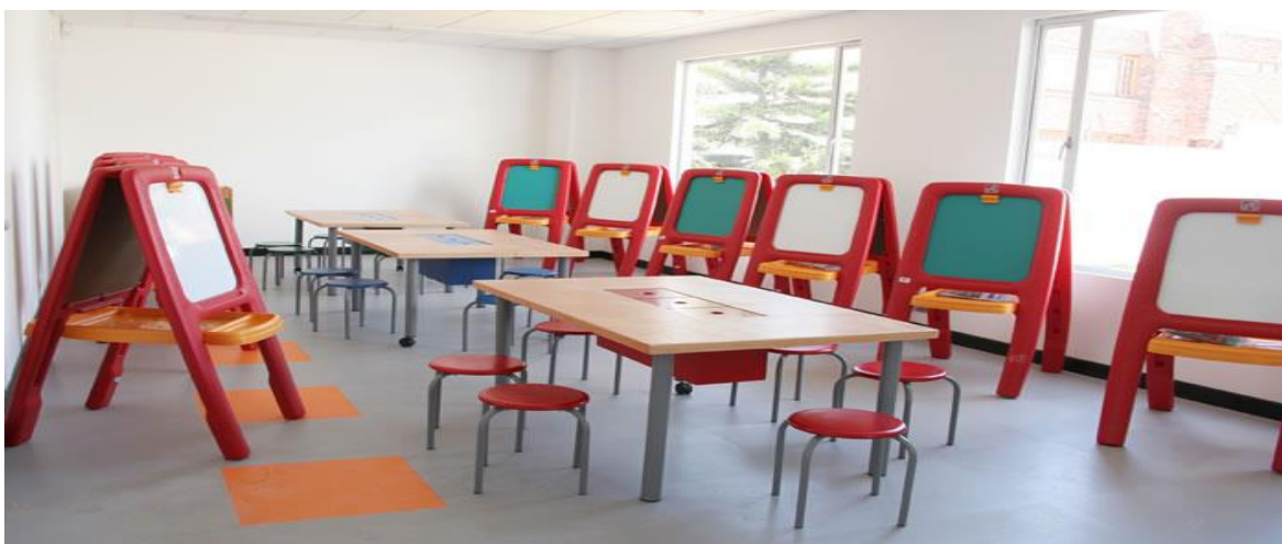
Figura 4. Modelo de referencia donde los espacios benefician la creatividad de los niños en un salón de artes creado de acuerdo con los requerimientos educativos