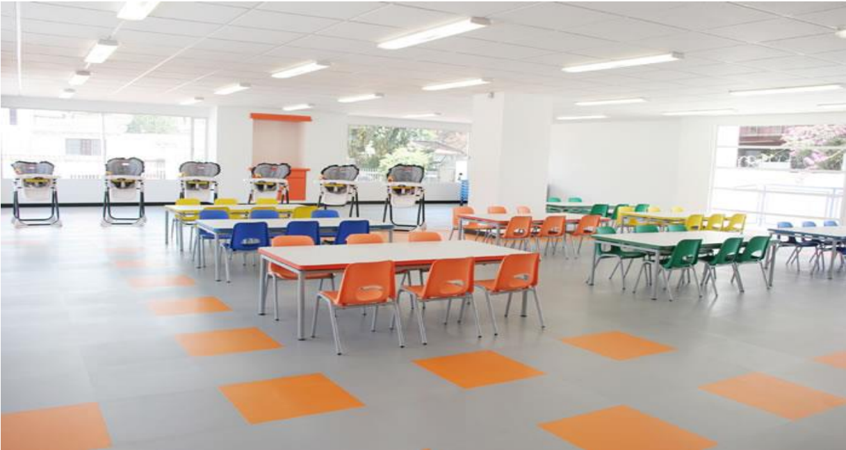
Figura 7. El comedor está especialmente construido para los niños en cada una de sus edades incluye los comedores auxiliares para los más pequeños.