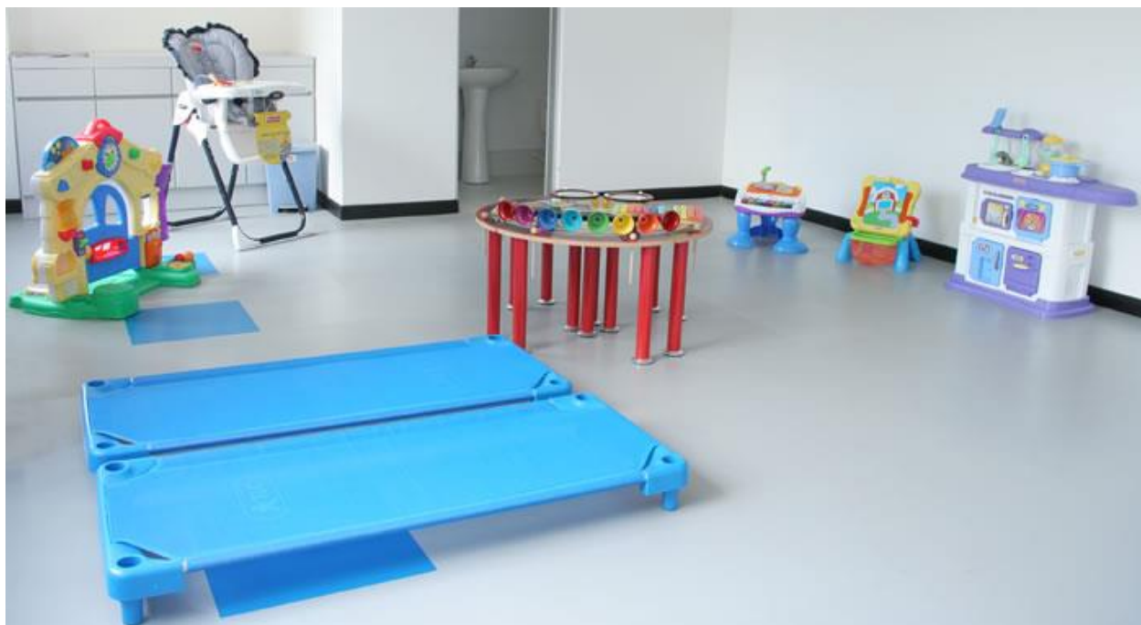
Figura 9. Desarrollado para que los niños entre sus clases también tengan un espacio para recrearse en un espacio controlado.