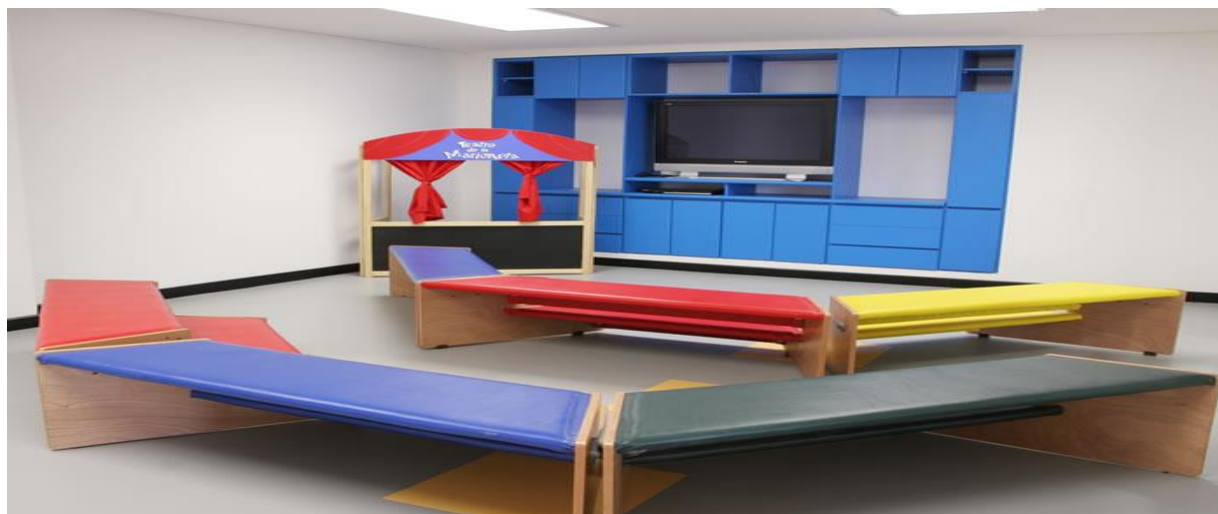
Figura 6. El salón de música es un espacio que permite que los niños desarrollen la lúdica y se familiaricen con el aprendizaje de la música, un espacio especial para este aprendizaje.