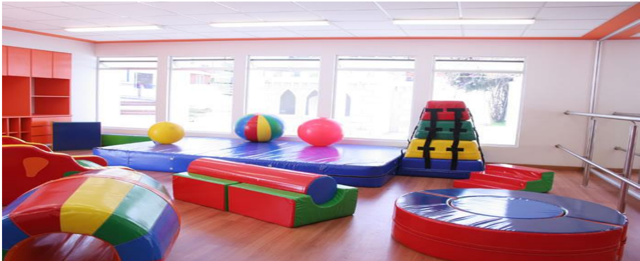
Figura 8. Espacio pensado en que los niños adquieran de manera segura las habilidades motoras que en cada edad deben desarrollar.