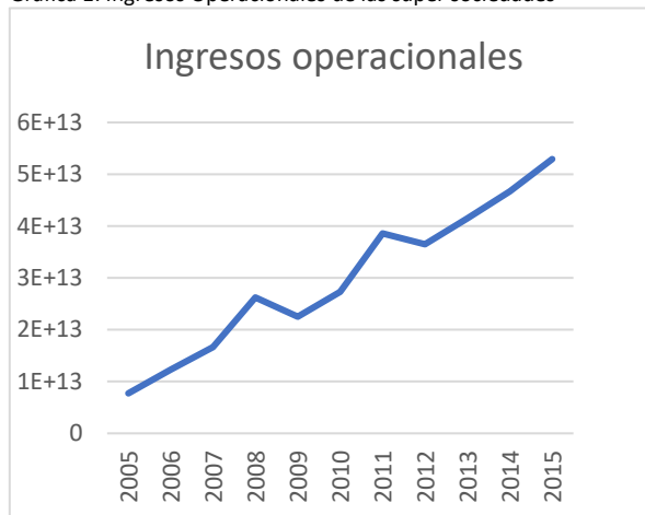
Gráfica 1: Ingresos Operacionales de las super sociedades