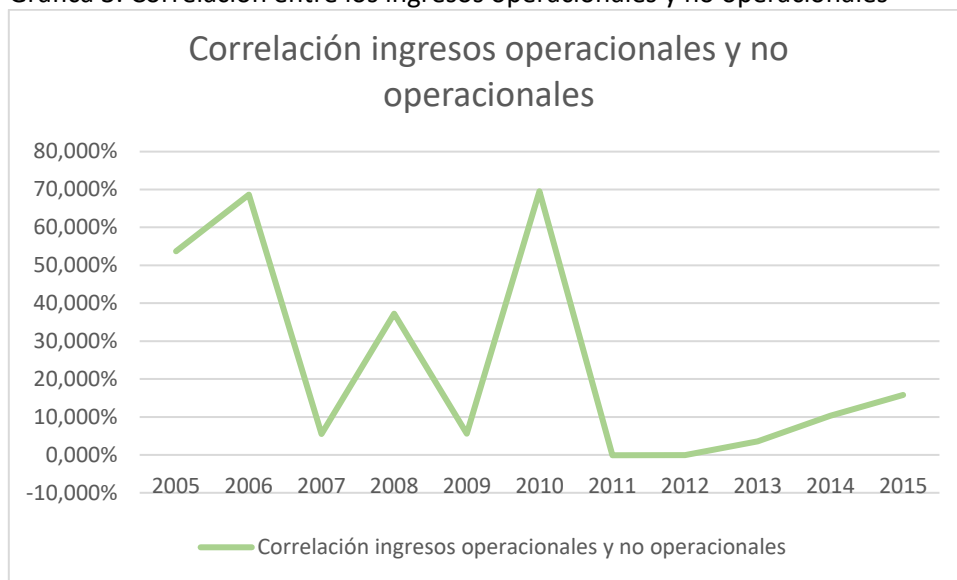
Gráfica 3: Correlación entre los ingresos operacionales y no operacionales