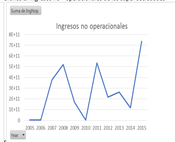
Gráfica 2: Ingresos no operacionales de las super sociedades

Fuente: Supersociedades y cálculos propios.