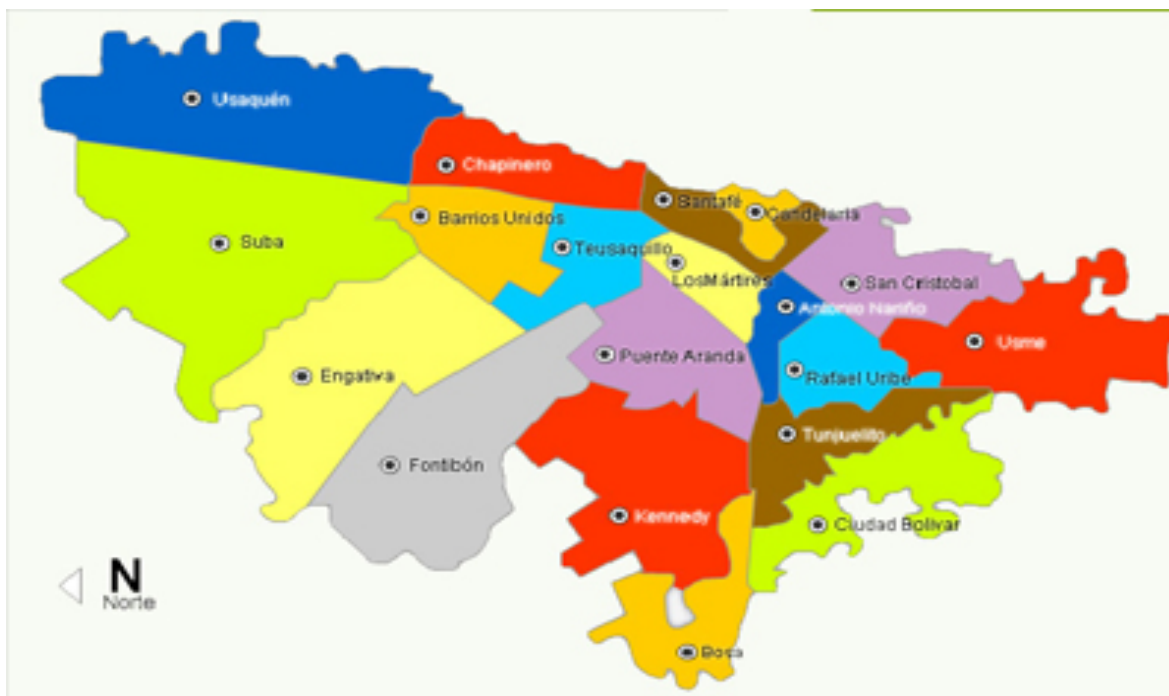
Figura 1. Mapa político de Bogotá, dividido por localidades.

Republica), legislativa (Congreso de Colombia) y judicial (Corte Suprema de Justicia, Corte Constitucional, Consejo de Estado y el Consejo Superior de la Judicatura).