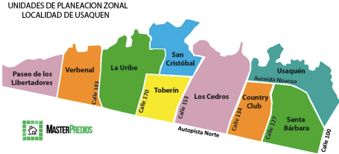
Figura 2. Unidades de planeación de la localidad de Usaquén.

Por su parte, el barrio Pradera Norte, hace parte de la UPZ (Unidad de Planeamiento Zonal) Toberín y se delimita de la siguiente manera, al norte, limita con la Calle 170 o Avenida San José, que lo separa del barrio La Alameda, al occidente limita con el Canal de Torca, que lo separa del barrio Santa Mónica, al sur limita con la calle 165, que lo separa del barrio Babilonia (Carrera 9 – Carrera 14) y el barrio Pantanitos (Carrera 14 – Canal de Torca) y al oriente limita con la Carrera novena que lo separa del barrio Danubio Occidental (Google, SF).