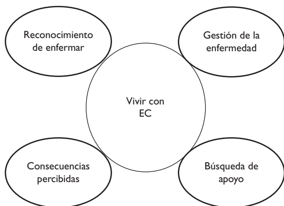
FIGURA 2. MAPA TEMÁTICO FINAL TRAS EL ANÁLISIS DE LAS ENTREVISTAS POR EQUIPO INVESTIGADOR