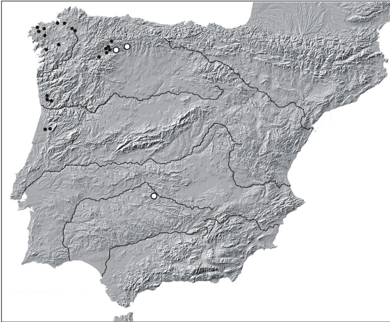
Fig. 5. Testimonios epigráficos de Cosus (círculos negros) y Vacus (círculos blancos) en la Península Ibérica.

va de Maternus y que fue hallada en Corral de Calatrava (Ciudad Real). 48 El ara no se halló en su ubicación original, pero la comarca de Corral de Calatrava está en el entorno inmediato de numerosas minas antiguas en los términos de Abenójar, Almodóvar del Campo, Brazatortas, Cabezarados, Cabezarrubias del Puerto, Calzada de Calatrava, Mestanza, San Lorenzo de Calatrava y Villamayor de Calatrava. 49 El teónimo Vacus está testimoniado en Astorga y La Milla del Río (León) (fig. 5) donde, además, existía un santuario dedicado al dios. 50 Por otra parte, el nombre de la dedicante a Vacus en Corral de Calatrava, Acara , está testimoniado en masculino con una variante fonética, como Acarius , exclusivamente en el área leonesa, en Barrillos de Curueño y Valencia de Don Juan (León), 51 lo que es un apoyo más a la hipótesis de una difusión del culto a la deidad desde la Meseta Norte hacia la región minera situada al sur del Guadiana aunque, como es lógico, los datos son demasiado escasos para que podamos considerar esta hipótesis como del todo fiable.