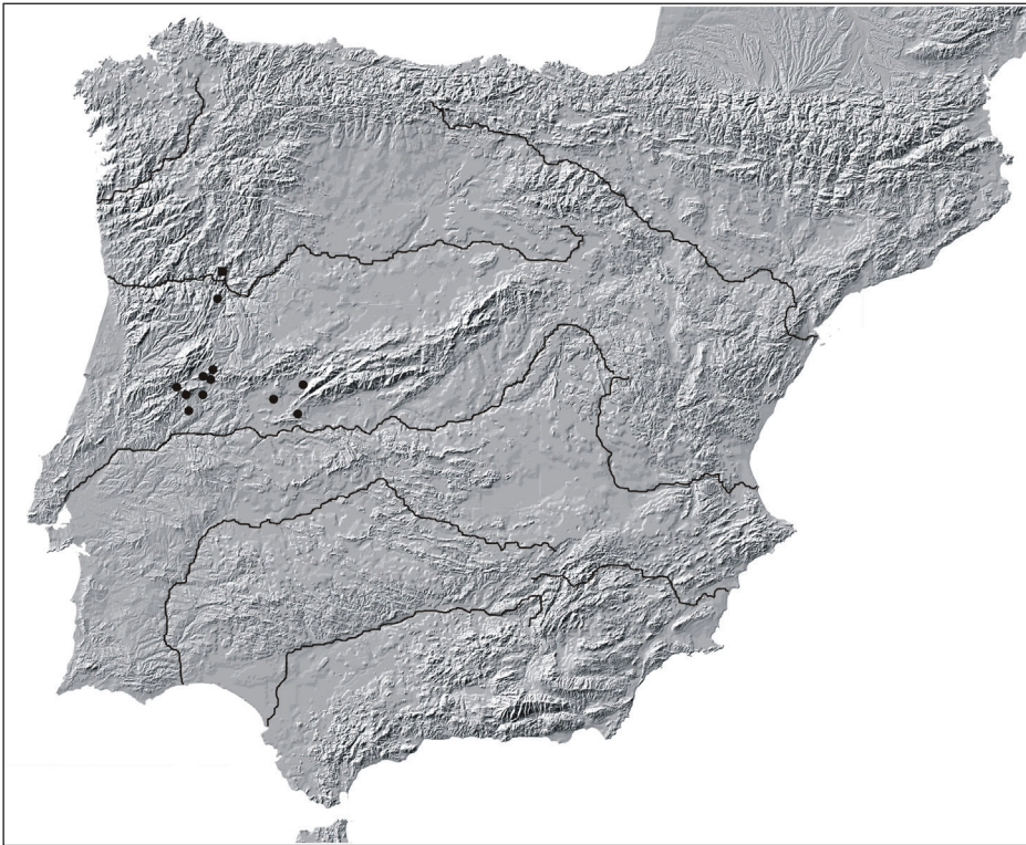
Fig. 7. Distribución territorial de las ofrendas a Bandi Vortaecece , con todas sus variantes fonéticas

Aproximadamente, 6 km hacia el sur de Seixo de Ansiães, aparece otra inscripción que, de nuevo, podría mostrar un desplazamiento de individuos hacia la región. Se trata de la ofrenda votiva de Tiberius Claudius Sailcius , caballero de la III cohorte de lusitanos, dedicada a los dis deabusque Coniumbrig(ensium) . 54 El lugar se sitúa a unos 150 km en línea recta desde Conimbriga , por lo que la dedicación a los dioses y diosas de la ciudad sólo se podría entender en un contexto de migración. Teniendo en cuenta que el oferente es un soldado, las causas de la ofrenda podrían ser varias, pero el hecho de que en esta región existan minas y se observen otros posibles fenómenos de transferencia cultural, como el de Bandu Vordeaece , nos induce a pensar en un nuevo proceso de emigración a territorios mineros.