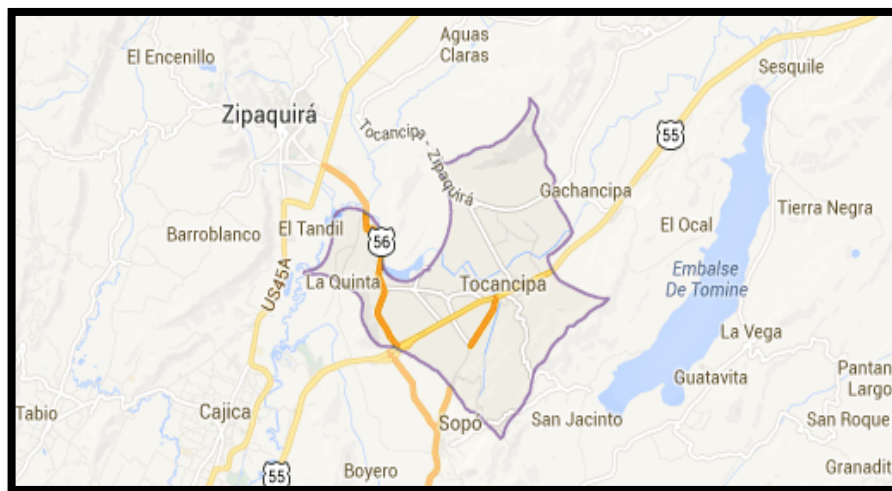
Gráfico 1 Mapa de Tocancipá