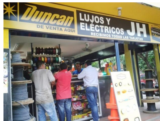
Imagen 3. Área Comercial Empresa Lujos Eléctricos JH