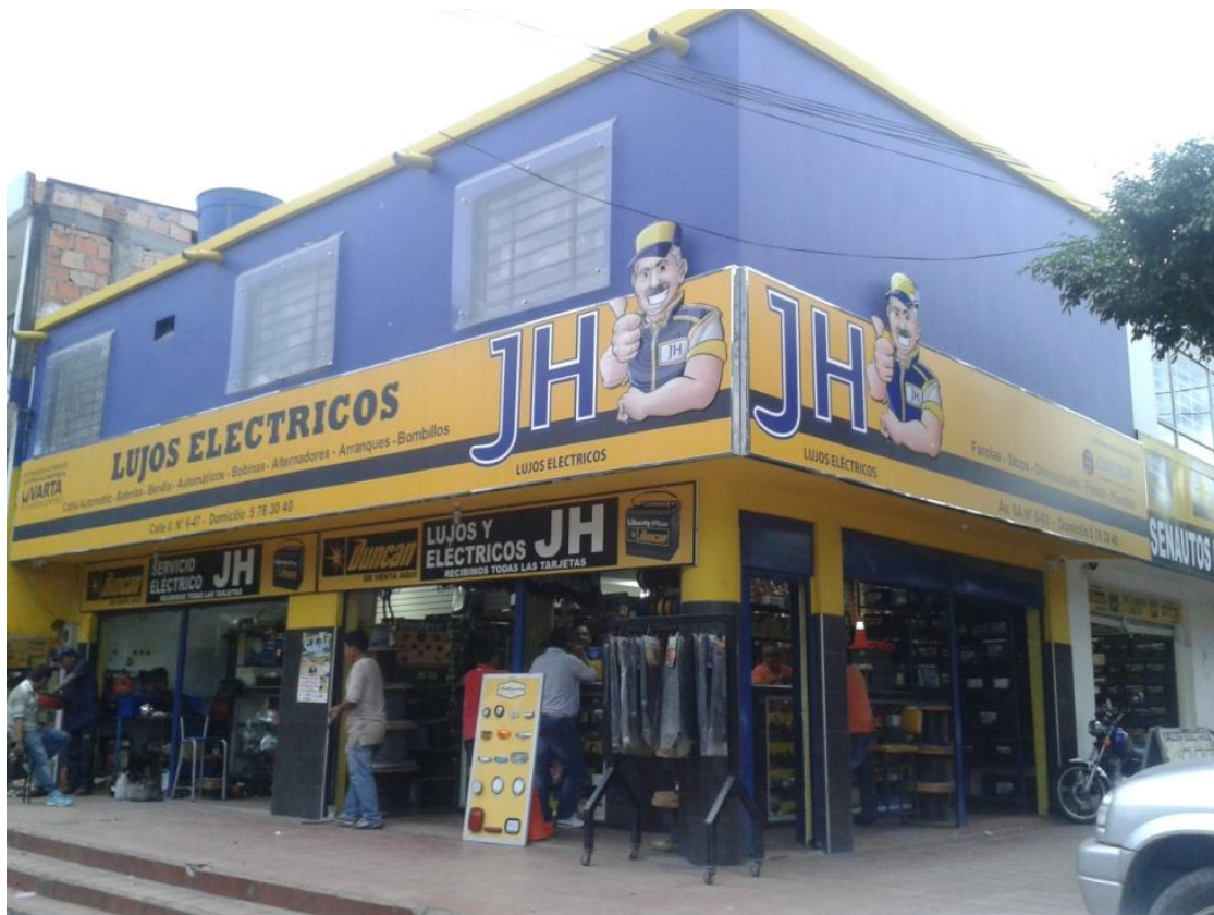
Imagen 1. Fachada de la Empresa Lujos Eléctricos JH con domicilio en la ciudad de Cúcuta