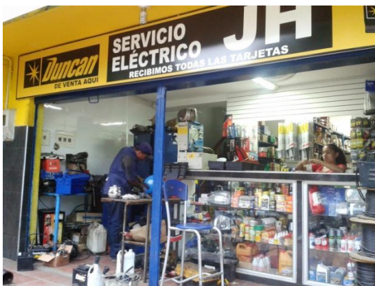
Imagen 2. Servicio Eléctrico Empresa Lujos Eléctricos JH

La empresa Lujos Eléctricos J.H. tiene una estructura básica de tipo vertical y lineal caracterizada por ocho áreas o departamentos. A la cabeza se encuentra la Gerencia General y asiste a la misma el área de Secretaria y Contabilidad . Seguido se encuentra la Gerencia Administrativa y Financiera , la cual está subordinada a la Gerencia General . Apoya a la Gerencia Administrativa y Financiera el área de Caja y Cartera . Del área de Gerencia Administrativa y Financiera se desprenden el área comercial , el área de bodega y el área de compras . Al mismo nivel de estas áreas se encuentra relacionada de forma indirecta el Servicio de Taller .