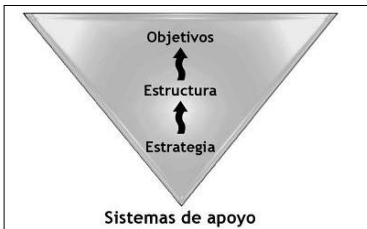
Gráfico 1. Estrategia, estructura, objetivos y sistemas

La estrategia desde las diversas perspectivas de los autores resulta de la evaluación inicial de la organización para imaginar un futuro en donde se cumpla con las exigencias de todos los grupos de interés o stakeholders . La creación de valor para cada uno de los actores relacionados directa o indirectamente con la empresa es el fin último. La pregunta siempre será cómo se logrará .