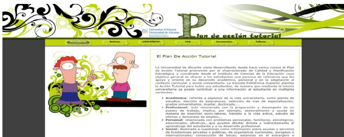
Figura 4. Pantalla principal de la web

La página web se estructura de la siguiente manera: