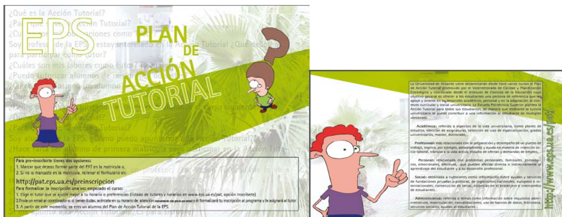
Figura 5. Nueva tríptico informativo

Al igual que se hizo el año anterior, para involucrar en el proceso a los departamentos de la EPS, se pidió a los directores de los mismos que hicieran una comunicación oficial sobre la existencia del programa con el fin de implicar también al resto de los docentes no tutores y conseguir de ellos una labor de difusión desde las aulas. Esta comunicación se reforzó después en las subdirecciones de cada titulación desde las que se envió otro mensaje de similares características. Estas acciones son las que se realizan para la difusión del plan en los estudiantes ya matriculados, pero a su