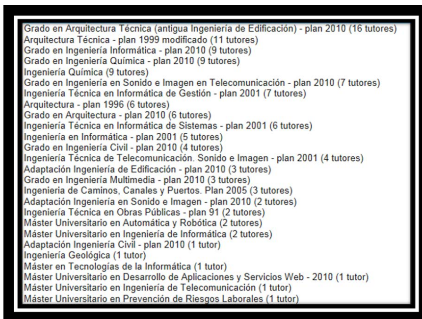
Figura 1. Tutores disponibles por titulación

Al igual que en el pasado curso, la filosofía de trabajo y la metodología de inscripción de estudiantes en el programa no toma como punto de partida los datos de matrícula y, por tanto, no se corresponde con los estudiantes totales de las titulaciones sino con los estudiantes realmente tutorizados.