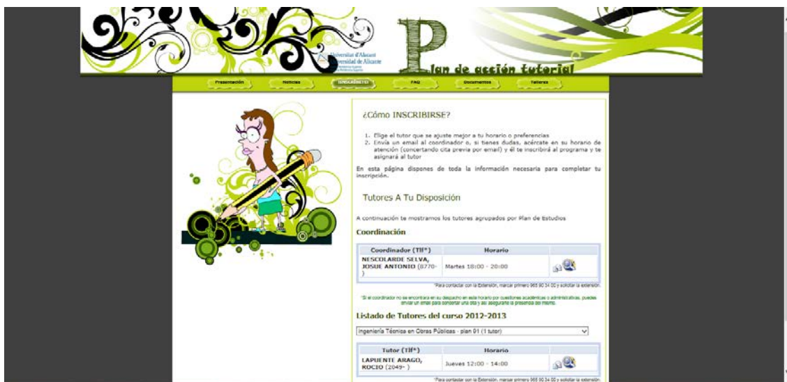
Figura 6. Opción de inscribirse en la web del PAT

Como ha ocurrido otros años, puesto que la asignación de estudiantes tutorizados a tutores se hace por petición propia de los estudiantes, algunos tutores finalmente no han tutorizado a ningún estudiante este año, y por tanto, a pesar de aparecer como tutores no se han contabilizado como tutores en activo.