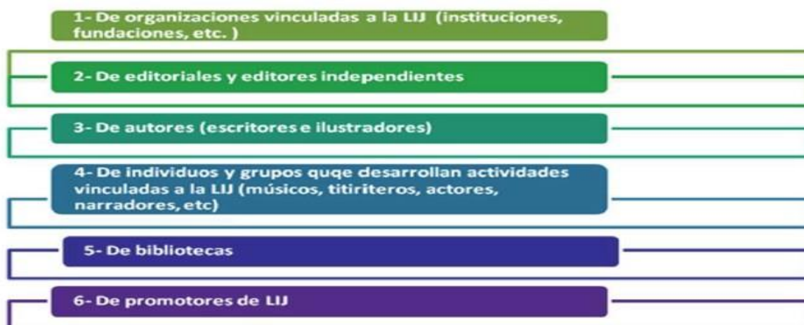
Imagen 3 Tipología de perfiles en Facebook relacionados con la LIJ. (Moglia 2011, p. 20).

Dentro de la plataforma podemos crear perfiles, páginas, grupos o incluso aplicaciones con múltiples objetivos. La promoción lectora puede ser uno de ellos y desde todos los ámbitos (autoras/es, editoriales, docentes, bibliotecas...) encontramos infinidad de propuestas centradas en la lectura literaria. Las nuevas formas de interacción nos permiten contactar directamente con personas de todo el mundo con gustos comunes, escribir directamente a una autora o autor, crear el perfil de una obra o un personaje, participar en un club de lectura... y otras muchas dinámicas que favorezcan el desarrollo de la competencia lectoliteraria.