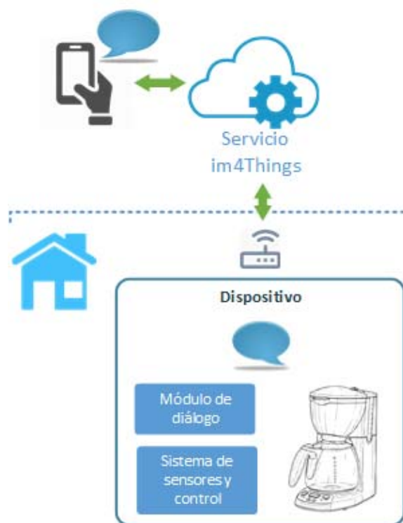
Figura 1: Arquitectura de im4Things

Como se ha comentado anteriormente, el sistema im4Things (ver Figura 1) está compuesto por tres módulos principales: la aplicación móvil de chat im4Things, el servicio im4Things y el dispositivo.