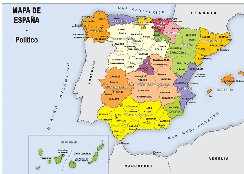
Figura 1. Situación geográfica

Fuente: Ministerio de Fomento-Dirección General del Instituto Geográfico Nacional, 2001.